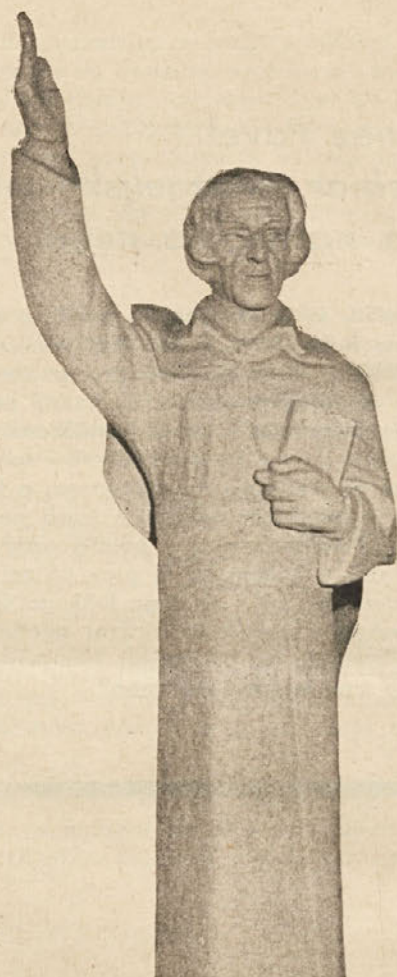
izvirnik kipa v glini v stiškem samostanu