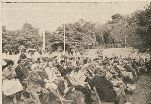
Med okroglo mizo

DRAGI sta z veliko pozornostjo sledila Radio TRST A (slovenska) in italijanska televizija. Titovski Primorski dnevnik je za razliko od prejšnjih let poročal objektivno in korektno, čeprav seveda hladno.