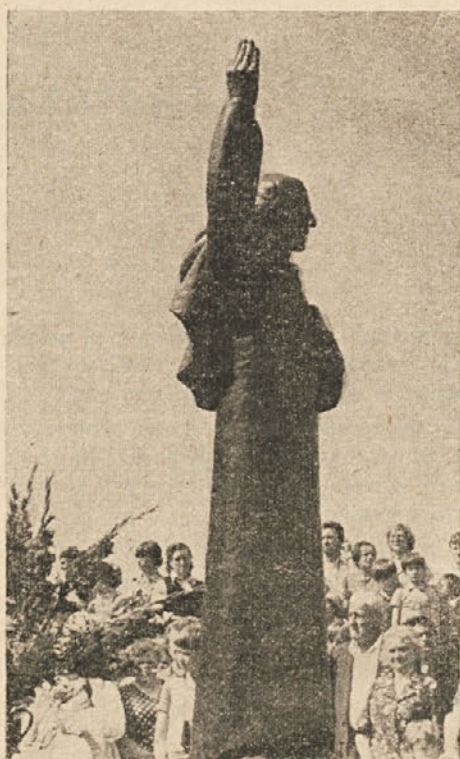
goršetov Baraga v Trebnjem (bron)