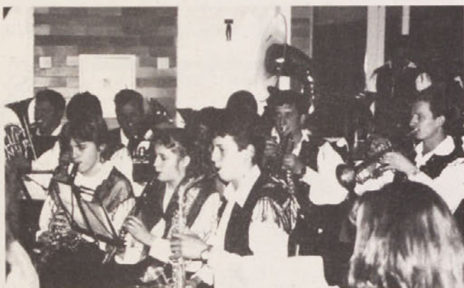
Celo v Kmečki godbi s Pernico so prve vrste še rosno mlade !

Te dni so se domala prav povsod, kjer obstajajo nižje glasbene šole, od Raven na Koroškem, Slovenj Gradca pa do Radelj, predstavili učenci naših glasbenih šol. Takšne predstavitve navadno obišejo le starši, prijatelji in sorodniki učencev. Pa bi mnogokrat in večkrat nastopi in igranje zaslužilo, da jih obiše še kdo. Predvsem pa, njihovo delo, delo teh šol in učiteljev je očitno v vseh godbah na pihala. Mlade moči, tudi strokovno dobro pripravljene, dajejo orkestru nove zvoke, dirigentom druge modnosti in nam večje kulturne užitke. Res je, da nas in starše te šole nekaj stanejo, ampak, kje v Sloveniji še imajo tolikšen glasbeni kulturni naboj ?