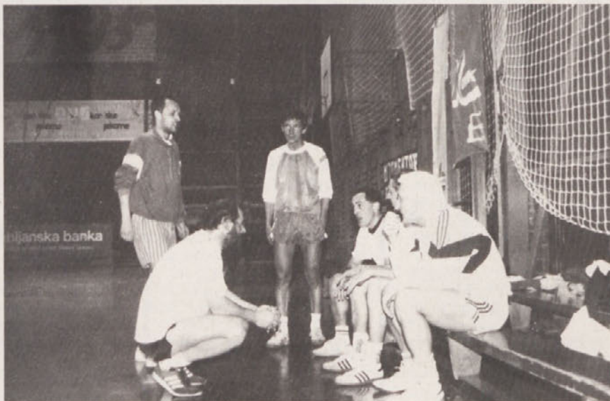
Posvet koroških novinarjev v odmoru, ko so proti policajem vodili z 1.0. Na koncu so zmagali s 4:1 in tako prvič premagali moštvo policajev. Prva a izdatna zмага.