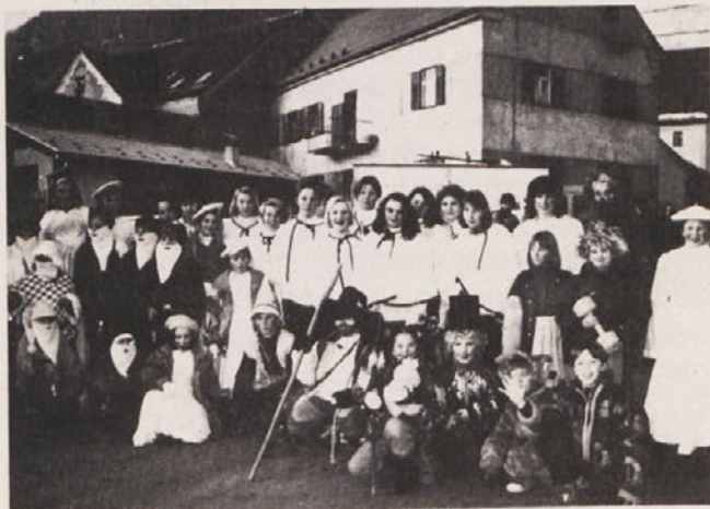
Naj se vidi, kakšni smo in koliko nas je!

Le redko kje so bili otroci, mladina, pa tudi starejši toliko in prijetno zaposleni, kot v Vuhredu v času zimskih počitnic. Pripravili so prvič prave žive jaslice ob Božiču in jih pokazali tudi v Radljah.