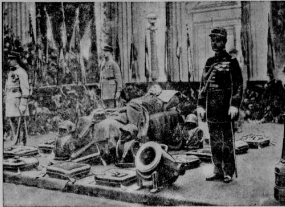
Maršal Joffre na mrtvaškem odru.

Do l. 1920. se je velik del teh duševnih slabičev zatekel k alkoholu kot dražilu; ko je potem izšla alkoholna prepoved, so se oklenili opojnih strupov. Svoj delež na razširjanju teh strupov imajo tudi tihotapci, ki jim tihotapljenje omamili več nese in je tudi lažje nego tihotapljenje z alkoholom.