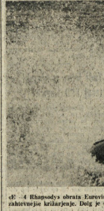
«E-4 Rhapsody» obrata Eurovinil je eden najboljših PVC napihljivih čolnov na tržišču, ki omogoča tudi zahtevnejše križarjenje. Dolg je 4,16 metra in izvrstno drži ob polni obremenitvi tudi s 25-kojskim krmnim motorjem

izredno odporen proti vsem kemičnim in tudi udarcem in odrgninam dobro prenasa. Edina težava je morda krpanje morebitnih poškodb, ki je izvedljiva samo v specializiranih delavnicah. Take napihljive čolne lahko svetujemo torej vsem tistim, ki jim vzdrževanje ni po godu, ki po potrepi pozabijo na svoj čoln v vlažni kleti. Kot zadnje naj omenimo, da so taki čolni lažji od klasičnih, kar prav pride pri prevozu in tudi pri izbiri krmnega motorja.