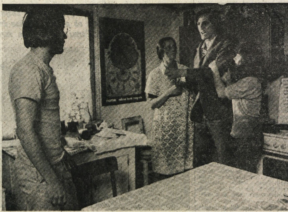
Na sliki: Prizor iz žižičevega filma «Daj što daš».