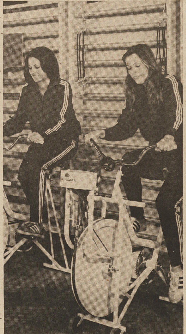
Zdravilišče Radenska je v okviru svoje „Nove terapije“ poskrbelo med drugim tudi za dva TRIM kabineta, kjer imajo obiskovalci na voljo najrazličnejše naprave za aktivno rekreacijo. Radenci se sedaj ponajajo tudi z novim pokritim plavalnim bazenom, ki sodi med najlepše tovrstne športne objekte v Sloveniji.

V generalni uvrstitvi so dosegli prvo mesto delavci Gorenja Muta, sledijo prosvetni delavci in delavci hidroelektrarn. kw