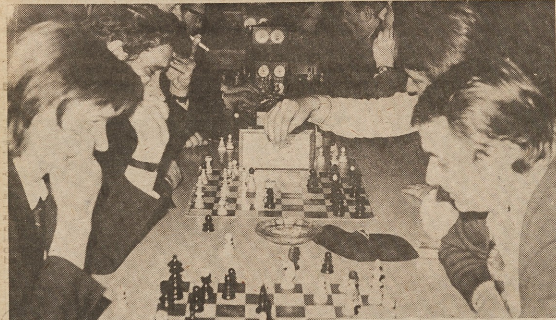
V veliki restavraciji tovarne gospodinske opreme „Gorenje“ Velenje je bilo v organizaciji domačega šahovskega kluba „Velenje“ veliko tekmovanje v šahu. Nastopilo je 51 članskih in 24 mladinskih ekip. Po pričakovanju so zmagali med člani Mariborčani, pri mladincih pa so slavili zmago mladi šahisti iz Celja. (L. O.)

Poleg tega se šolsko športno društvo lahko pohvali še z odličnimi atleti, obetajočimi mladimi košarkarji, pa tudi igralci namiznega tenisa. Sploh sodi šolsko športno društvo v Brdih med najbolj aktivna društva pri nas, zato tudi žanje tako lepe uspehe.