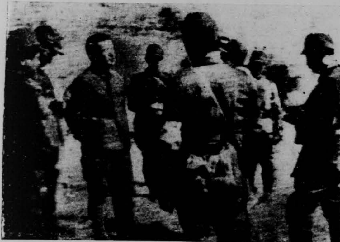
Ruski častnik (gologlav) se z japonskimi častniki pogaja za mir. Po večmesečnih bojih je bilo med Rusijo in Japonko v Mongoliji sklenjeno premirje.