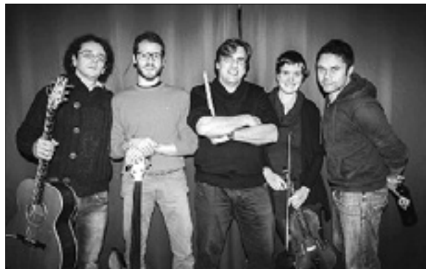
Skupina Da Capo a Coda

Pevec iz Karibov, južnotirolska violinistka, japonski basist, sicilijanski bobnar in tržaški kitarist, to je zasedba skupine Da Capo a Coda, ki bo nastopila na sobotnem koncertu v baru Il posto delle fragole v okviru prireditev v kulturnem parku pri Sv. Ivanu. Začetek ob 21. uri.