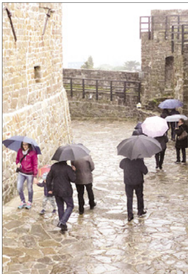
Velikonočni ponedeljek na goriškem gradu (levo) in v vrtu Viatori (desno)

Slabo vreme je nekoliko skvarilo tudi velikonočni ponedeljek v grajskem naselju, kjer napovedanih iger za otroke niso mogli prirediti, ni pa ustavilo obiskovalcev goriškega gradu. Samo v ponedeljek jih je bilo 1061. Med temi, ki so opremljeni z dežniki romali v trdnjavo na grajskem griču - vstop v muzej je bil ob