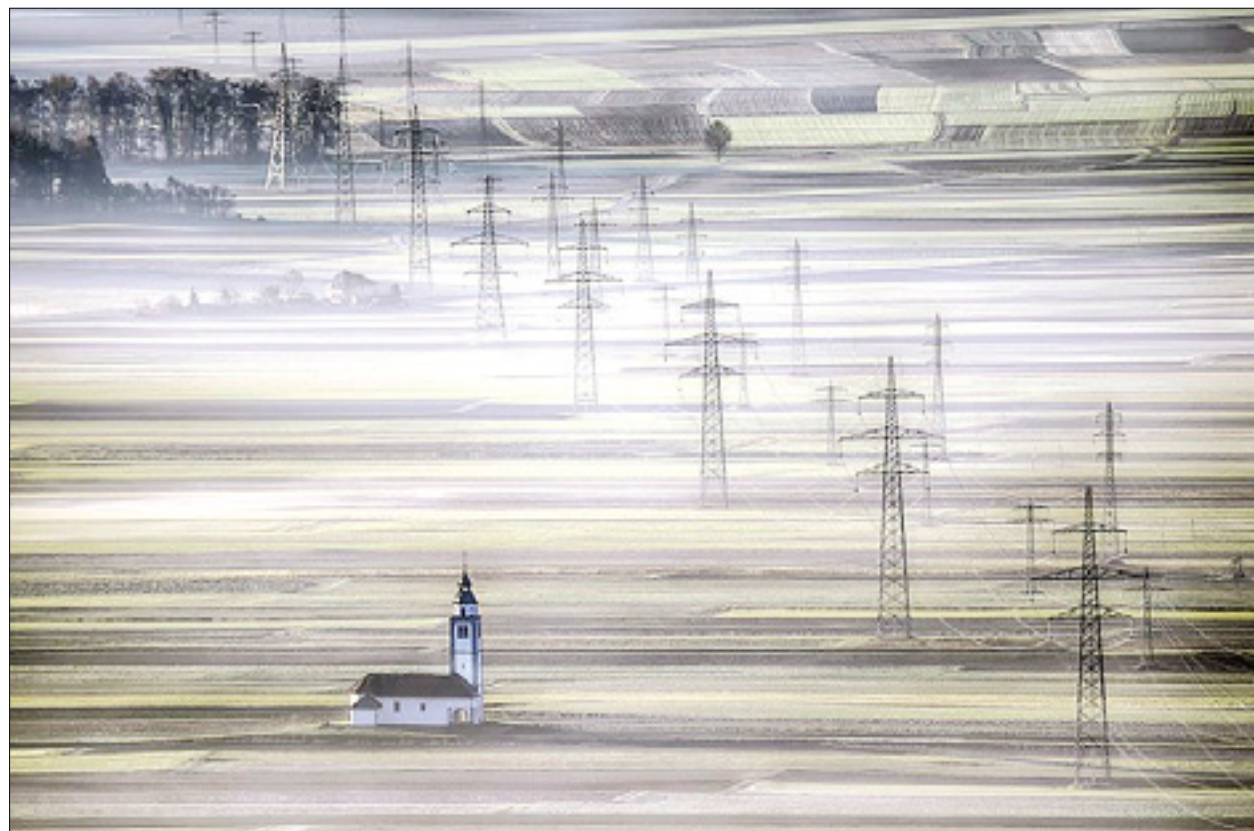
Andrej Tarfila: Cerkev na poljih Sorškega Polja

»Po lepe motive ni potrebno oditi na drug konec sveta«