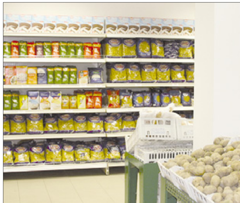
Tržiški emporij solidarnosti

V emporiju solidarnosti, ki so ga v Verdijevi ulici v Trziču odprli 17. aprila lani, je že poiskalo pomoč 1028 ljudi. Tako kot v goriški »solidarnostni trgovini« v Ulici Faiti tudi v tržiškem emporiju brezplačno delijo osnovna živila revnejšim posameznikom in družinam. Od začetka delovanja so porazdelili že za 176.000 evrov hrane in drugih potrebščin.