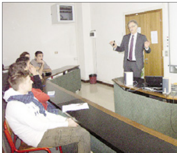
Predavanje rektorja tržaške univerze dijakom Žige Zoisa