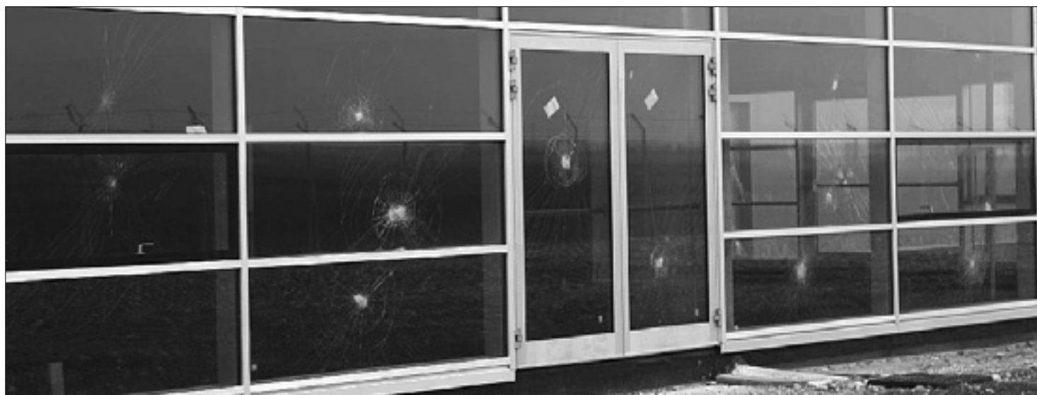
Poškodovanih je štirideset stekel