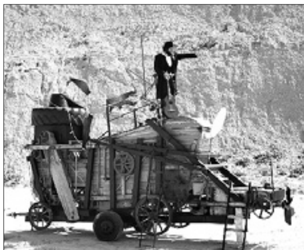
Prizor iz filma