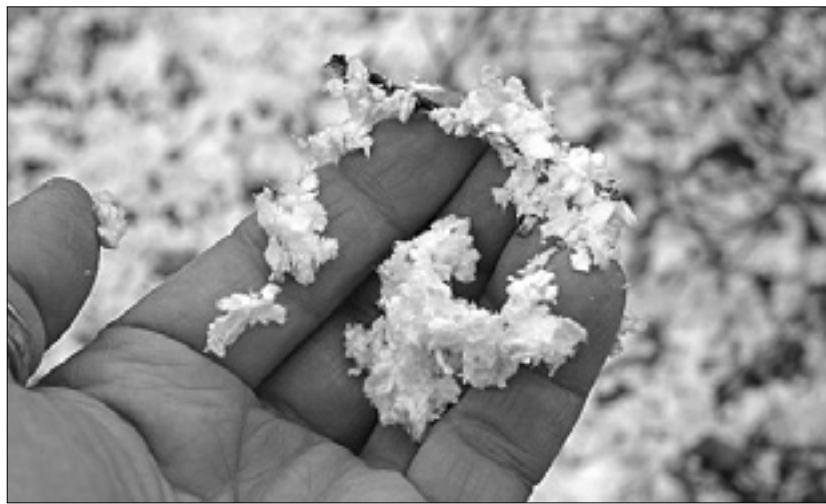
Velikonočna idila: s celuloznimi kosmiči posejan gozd blizu Pečine nad Borštom