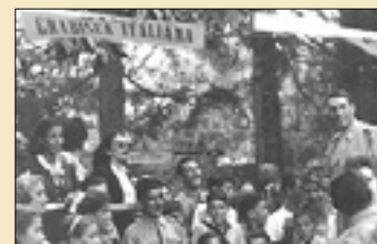
Italijanski vojaki v Gradišču l. 1947

Za delovanje emporija skrbi dvajseterica prostovoljcev. Pri projektu z nadškofijsko Karitas sodelujejo občina Trzič, ki je prispevala 25.000 evrov, goriška pokrajina, ki je emporiju namenila 2500 evrov, in Fundacija Fundacije Goriške hranilnice, ki je projektu namenila 40.000 evrov. Zelo pomemben je tudi doprinos zasebnih podjetij, društev in posameznih občanov, ki zbirajo hrano za revnejše družine.