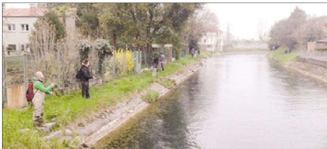
Ribiči ob kanalu De Dottori v Zagraju (levo); ujeta potočna postrv (spodaj)

Največ ribičev se je zbralo ob kanalu De Dottori - Na Soči uspešni le najspretnjejši