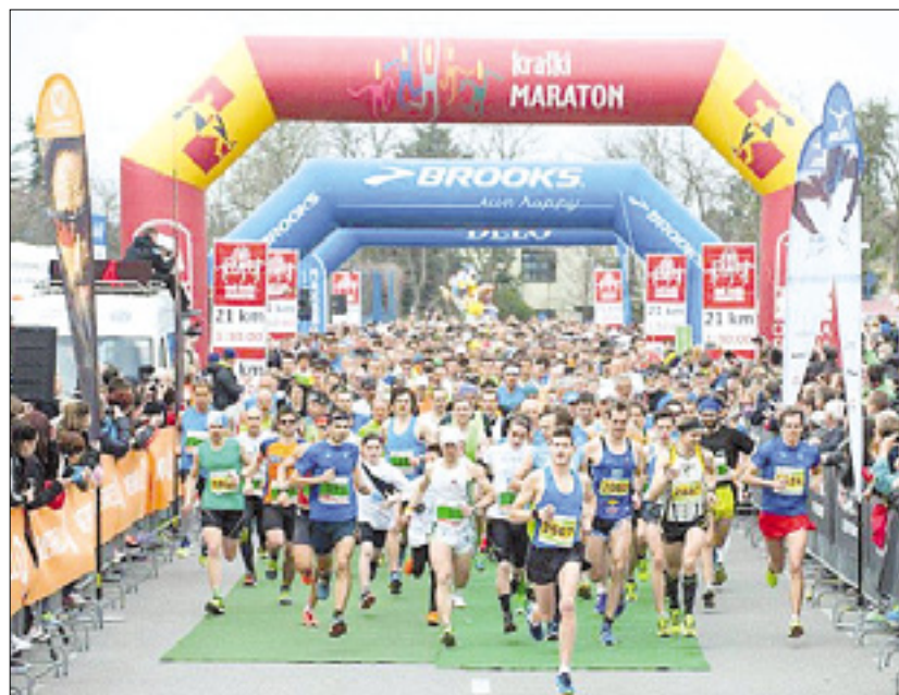
V nedeljo na startu 16. Malega kraškega maratona v Sežani