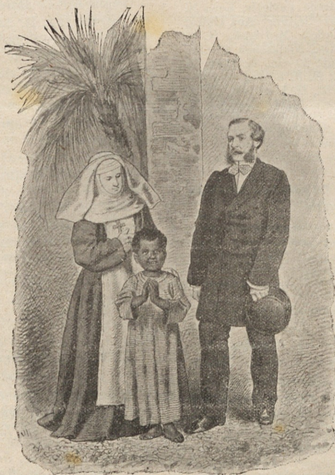
Krščansko vzgojena zamorska deklica.