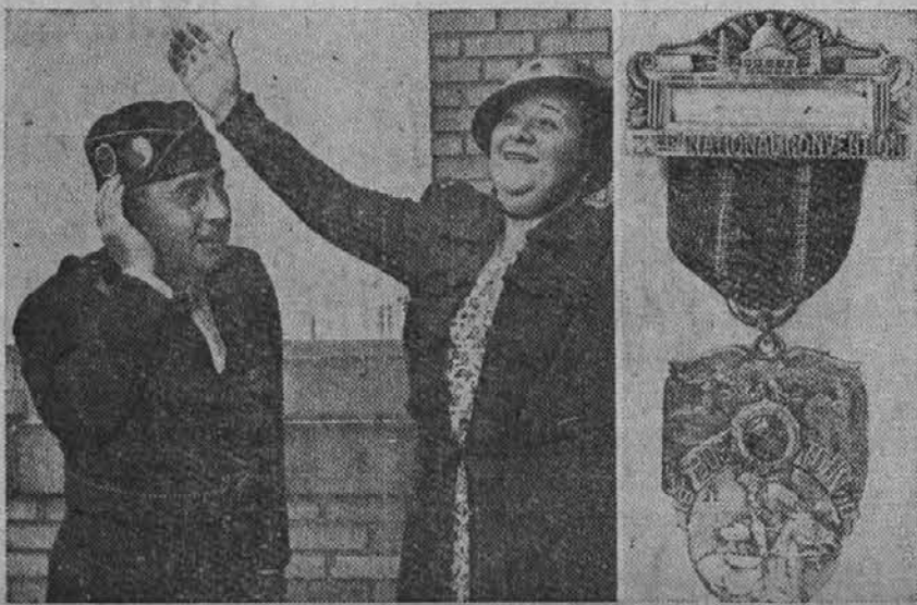
Na sliki je Sophie Tucker, znana ameriška pevka, ki bo nastopila tudi pred delegati konvencije Ameriške legije, ki se bo vršila dne 25. septembra v Bostonu.