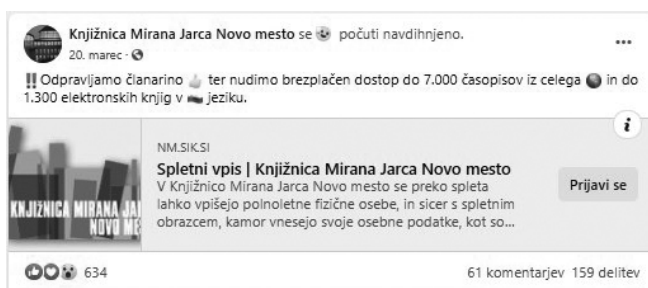
Slika 2: Najbolj všečkana objava Knjižnice Mirana Jarca Novo mesto o brezplačnem spletnem vpisu