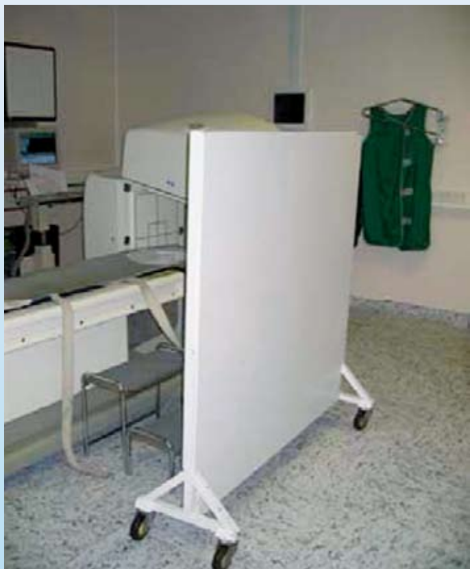
Slika 4: Svinčeni paravan za zaščito pred sevanjem iz pacienta (Grmek, 2004)

Poleg svinčene zaščite so pri delu s pozitronskim sevalcem F-18 med pripravo radiofarmakov potrebna še dodatna plastična in steklena zaščitna sredstva (Delacroix in Guerre, 2002). V praksi se uporablja 1,7 mm debela plastična zaščita (Grmek in Tomše, 2009) v kombinaciji s svinčeno zaščito. Plastična zaščita absorbira beta delce, svinčena pa ščiti pred anihiliranimi fotoni.