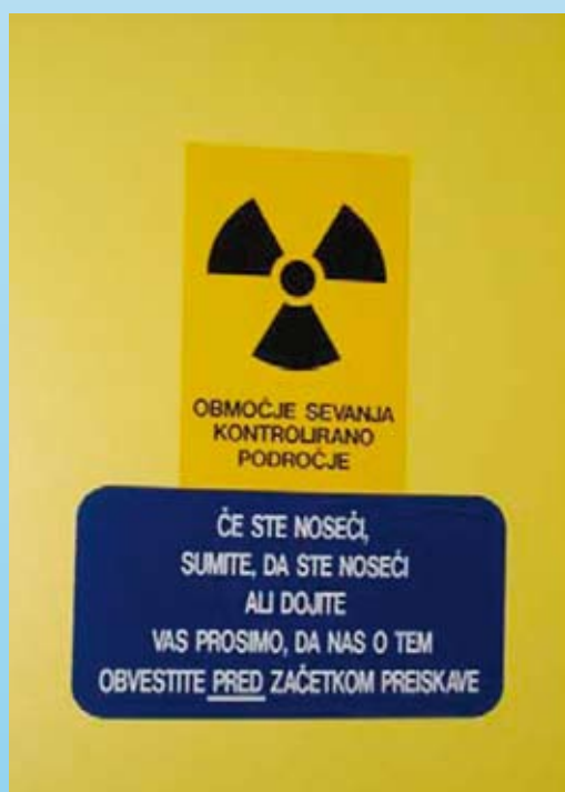
Slika 1: Opozorilo na vstopu v nadzorovano območje (Grmek, 2004)

V nadzorovano območje poleg vročega laboratorija za pripravo odmerkov radiofarmakov in skladišča radioaktivnih odpadkov sodijo tudi prostori za scintigrafske slikovne preiskave (Grmek, 2004; Grmek in Tomše, 2009; Zdešar, 2011). Območja so označena s posebnimi opozorili.