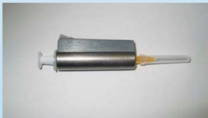
Slika 2: Svinčena zaščita za brizgo z radiofarmakom (Grmek, 2004)

Za zaščito pred radiofarmaki ki vsebujejo Tc-99m, se uporabljajo svinčeni vsebniki, ki omogočajo varen transport radioaktivnih snovi. Svinčeni ščitniki se uporabljajo tudi med aplikacijo radiofarmaka (Grmek, 2004).