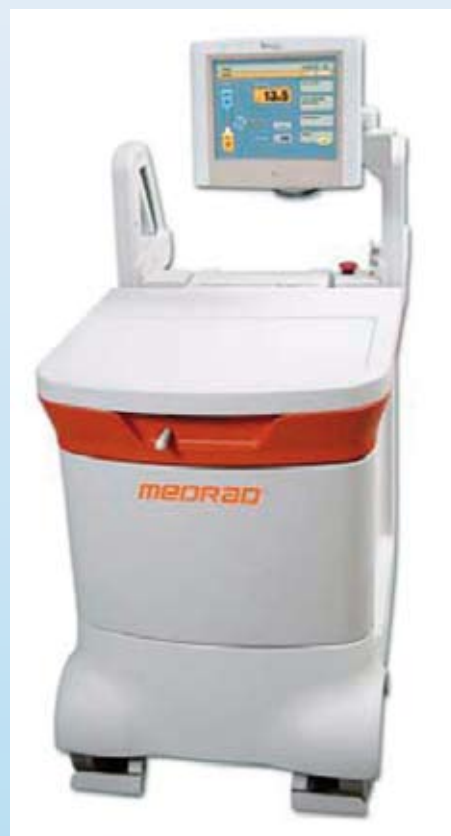
Slika 5: Avtomatski aplikator (Grmek in Tomše, 2009)

^{18}\text{F} -FDG dostavijo na KNM v zaščitnem vsebniku, ki se neposredno premesti v avtomatski aplikator. S tem se izognemo potencialno največjim hitrostim doze za radiološke inženirje pri potencialni ročni aplikaciji radiofarmaka (Grmek in Tomše, 2009).