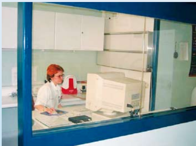
Slika 6: Zaščitno steklo v nadzornem prostoru SPECT-CT (Grmek, 2004)

Z namenom oslabitve vplivov rentgenske svetlobe in pozitronskih sevalcev so stene prostora, v katerem je naprava PET-CT, opremljene z 18 do 25 cm debelo betonsko zaščito, za njo pa se nahaja 8 mm do 16 mm debela svinčena zaščita (Grmek in Tomše, 2009). Vrata so zaščitena s svinčeno pločevino. Zaščita za rentgensko svetlobo CT naprave je nameščena na okna diagnostičnega prostora. Dodaten varnostni sistem so varnostna stikala na vratih, ki preprečujejo ekspozicijo CT-ja, če so vrata odprta (Zdešar, 2011).