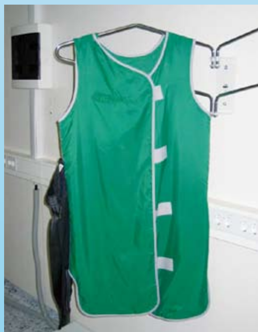
Slika 3: Svinčeni plašč (Grmek, 2004)

Svinčeni plašči debeline 0,25 mm do 0,5 mm ekvivalenta svinca se uporabljajo samo v primeru aplikacij višjih aktivnosti Tc-99m (Grmek, 2009).