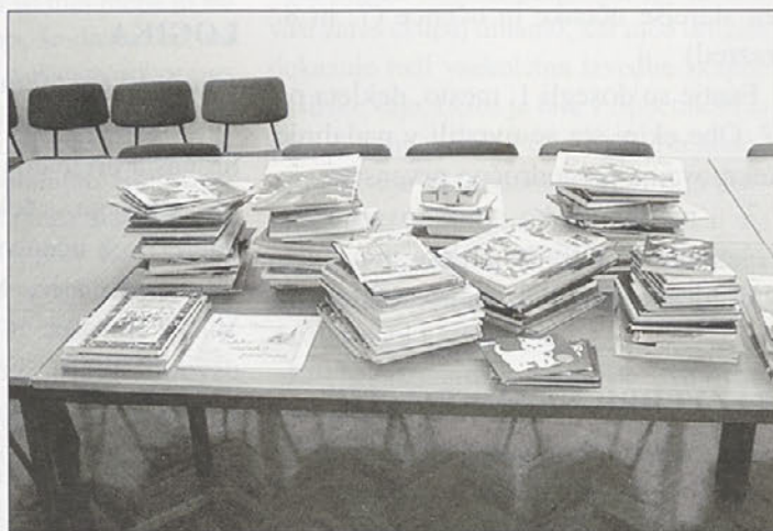
V okviru dobredelne akcije Podari objem smo zbrali čez 250 knjig, ki so jih prispevali učenci naše šole.