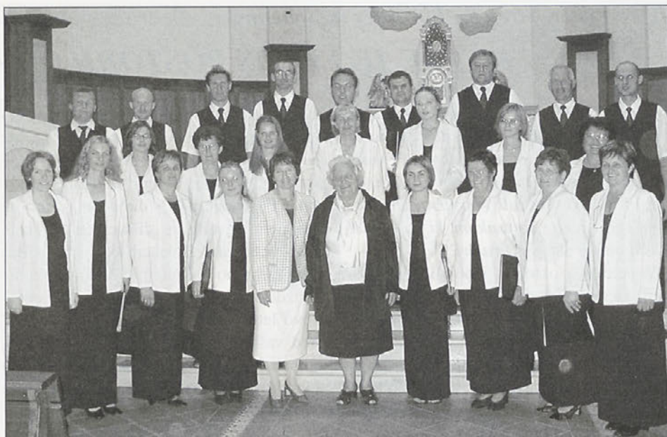
Pevci cerkvenega pevskega zbora tudi letos vabijo na tradicionalni božični koncert.

Po avtocesti smo se odpeljali mimo Imole, Bologne in Padove do Benetk, ki so