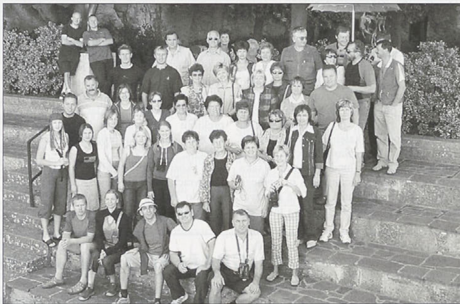
Markovski pevci med potepanjem po Italiji.

Pot smo nato nadaljevali po stari cesti mimo slikovitega pristaniškega kraja Chioggia, imenovanega male Benetke, mimo Pompose z najstarejšo benediktinsko opatijo in do naslednjega daljšega postanka za ogled mesta Ravenna. Tam smo se najprej ustavili pri Teodorikovem mavzoleju iz leta 520, ki pritegne pozornost obiskovalcev s svojo arhitekturo. Grajen je iz velikih blokov istrskega kamna, še posebej zanimiva pa je streha, narejena iz enega samega kosa s premerom 11 metrov, na sredini je debela dober meter in tehta 500 ton. Na pot po mestu smo se odpravili peš in si najprej ogledali slikovit Narodni trg z mestno hišo in privlačnimi arkadami. Nato smo se odpravili do narodnega muzeja in obiskali najlepše bizantinske stenske mozaike na zahodnoevropskih tleh v baziliki svetega Vitala, ki jih