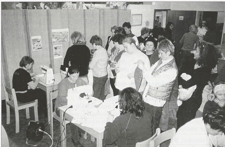
V vrtcu Markovci so vzgojiteljice zaposlile tudi starše, ki so med delavnicami izdelovali mehke blazinice in novoletne voščilnice

Ker je Božiček sporočil, da bo obiskal tudi naš vrtec, ga že težko pričakujemo in vsak dan spremenimo naš vrtec v pravo malo delavnico, kjer otroci izražajo svojo ustvarjalnost in domišljijo. Izdelali smo tudi palčke in z njimi okrasili vrtec ter okraske iz slanega testa, s katerimi smo okrasili našo smrečico. V kotičku kuhinja bomo spekli okusne piškote, da bo v vrtcu tudi praznično dišalo. Naučili se