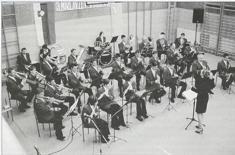
mz Godba na pihala občine Markovci