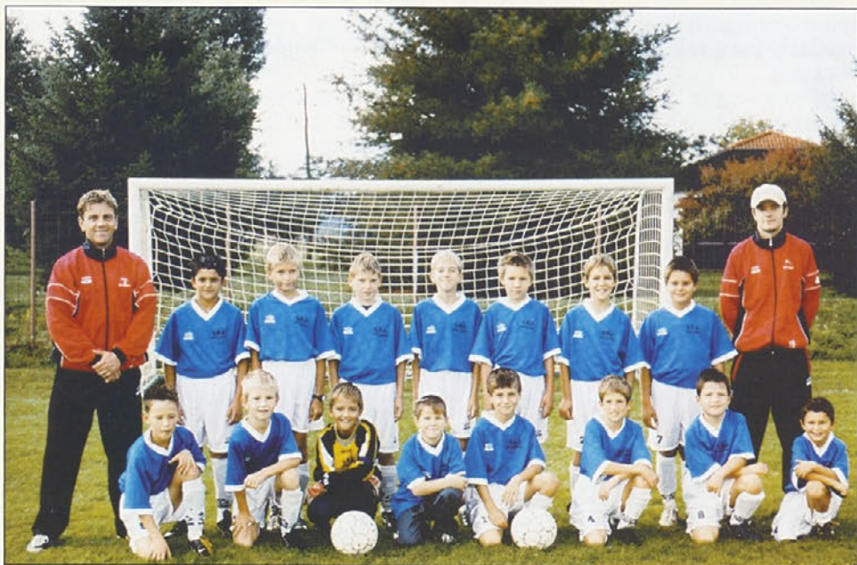
CICIBANI (U-10)-NK Markovci