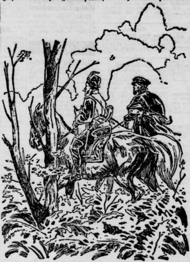
Baron in Saint Luc sta se bavila ves dan do večera z lovom, in lovci so imeli dovolj posla...

Ali Diana ni ostala samo pri tem, marveč se nežno izvije iz objema in se povrne k svoji prijateljici, ki se je izprva oddaljila nekoliko korakov, potem pa se polagoma vrnila, ponajveč iz radovednosti. Vrnila se je, ne da sodeluje na razgovoru, ampak da prisluškuje. „Kaj, tako me sprejemate, gospa?“ vprašuje Bussy. „Ne,“ pravi Diana, „to, kar ste storili, gospod de Bussy, je gotovo nežno in ljubeznjivo, ali...“ „Oj, ne iščite nobenega ali!“ vzdihne Bussy in si poišče mesta pri njenih nogah. „Ne, ne, ne kličite tako, gospod de Bussy!“ „Ali dopustite, da vsaj trenutek pomolim k