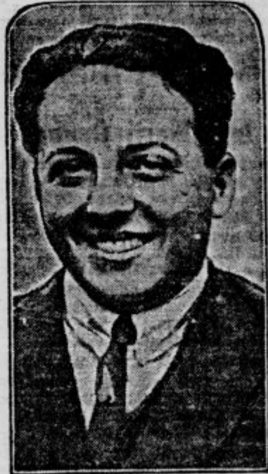
Slika kaže italijanskega avtomobiliskega dirkača, ki se je ponovno proslavil v zadnjih dneh. Conte Mussetti je na francoskem vozilu dosegel Grand Prix mesta Rima v dirki okrog Monte Mario.

Sela upravnege odbora JZSS. se vrši v ponedeljek ob pol 9. zvečer v kavarni Emona.