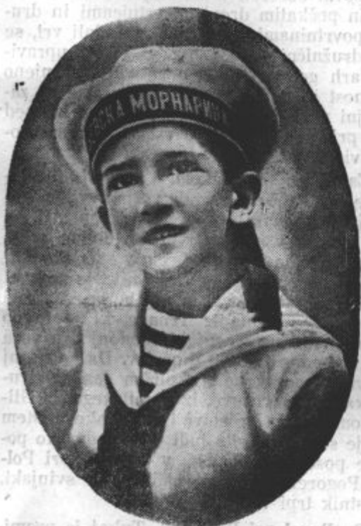
Prestolonaslednik Peter starosta Sokola Kraljevine Jugoslavije.

Na Vidov dan so dosegle sokolske svečanosti v Beogradu vrhunec. Dopoldne se je vršila v saborni cerkvi svečana služba božja, kateri sta prisostvovala tudi Nj. Vel. kralj in kraljica ter celokupna vlada in zastopniki tujih držav, popoldne pa je bil glavni sokolski nastop.