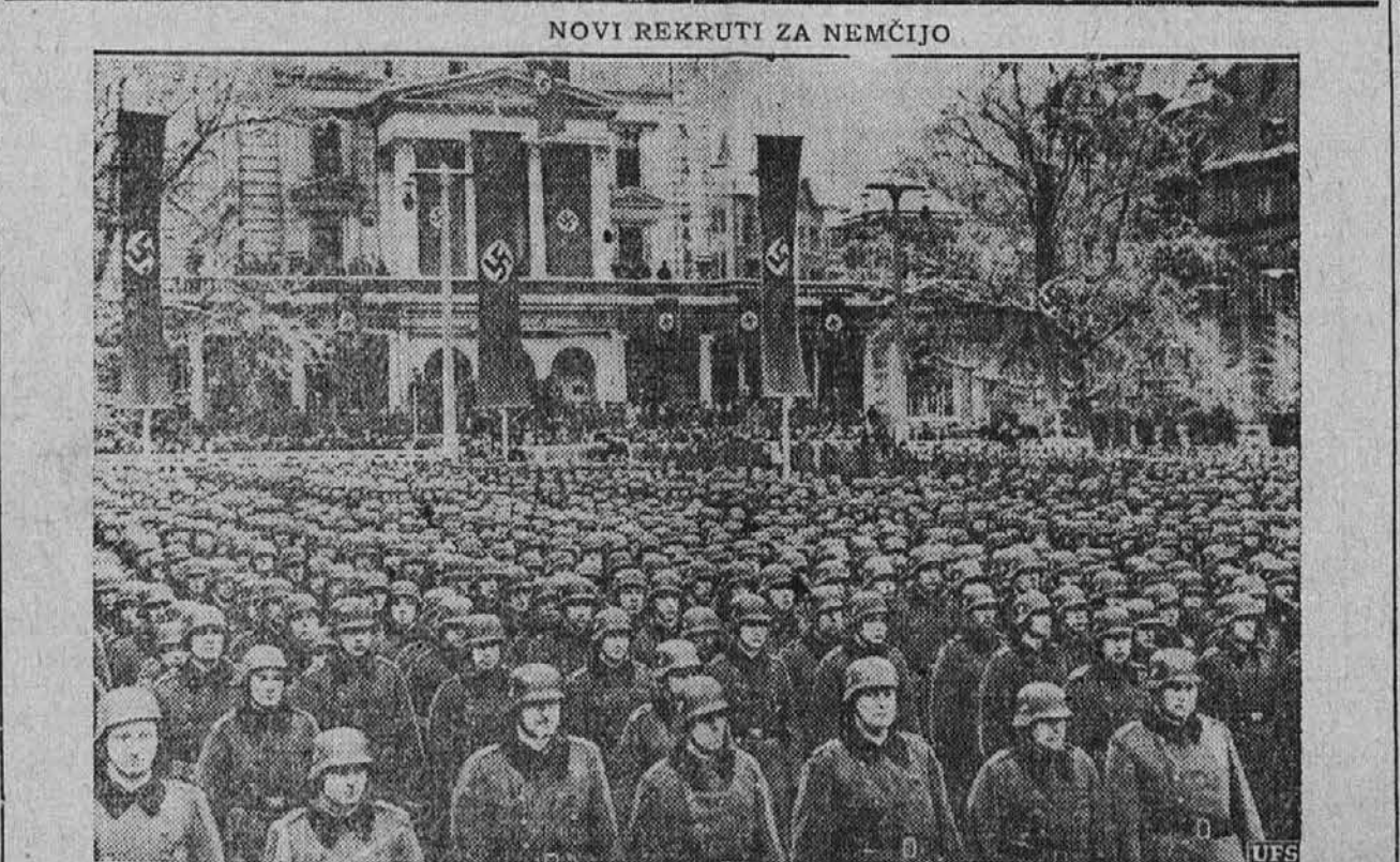
Slika kaže, ko je bilo zapriščeno novo vojaštvo za Nemčijo, rekrutirano iz province Poznanj, kakor je tvorila del bivše poljske države.