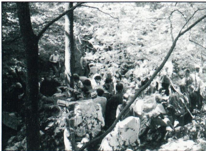
Letos so prizadevni jamarji spustili v Logaško jamo 205 ljudi, kot rekordnega leta 1992