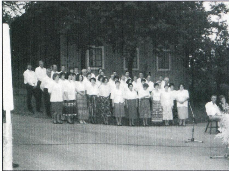
Pomnoženi zbor DMG pred nastopom