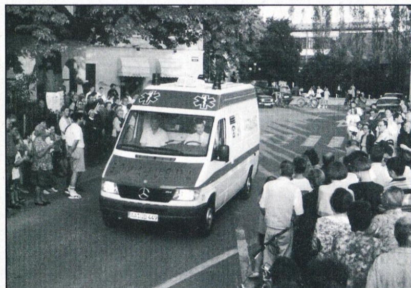
Novo reševalno vozilo med vožnjo proti slavnostni tribuni