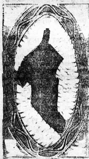
180 lastnih trgovin.