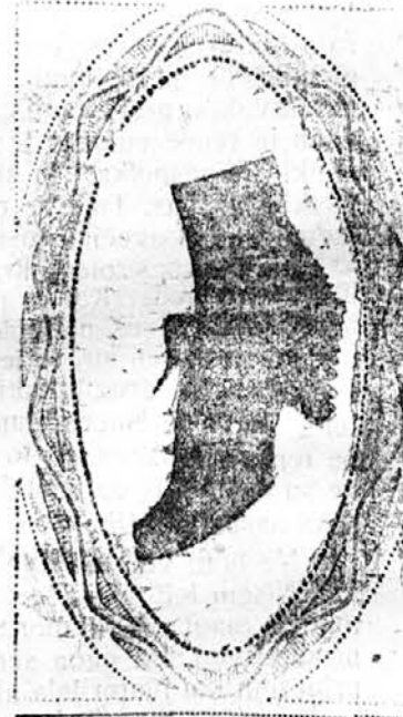
30.000 parov tedensko. 1200 delavcev in nastavljenec.