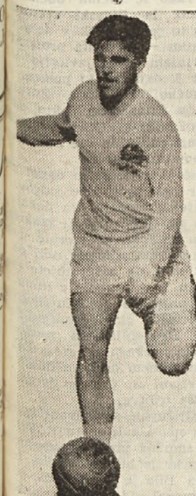
Četrtfinalni najboljši nogometni napadalec v Evropi in na svetu Puskas, ki igra v sestavi vrhunske madžarske enajsterice.

V nedeljo bodo naši športniki s Proseka-Kontovale proslavili 30. obletnico ustanovitve svojega športnega društva. Za to priliko bo na Proseku večja prireditev, na katero opozarjamo tudi naše bralce. Za to priliko bo izšel tudi poseben spominski album z opisom delovanja društva "Primorje" od dneva ustanovitve pa do današnjih dni.