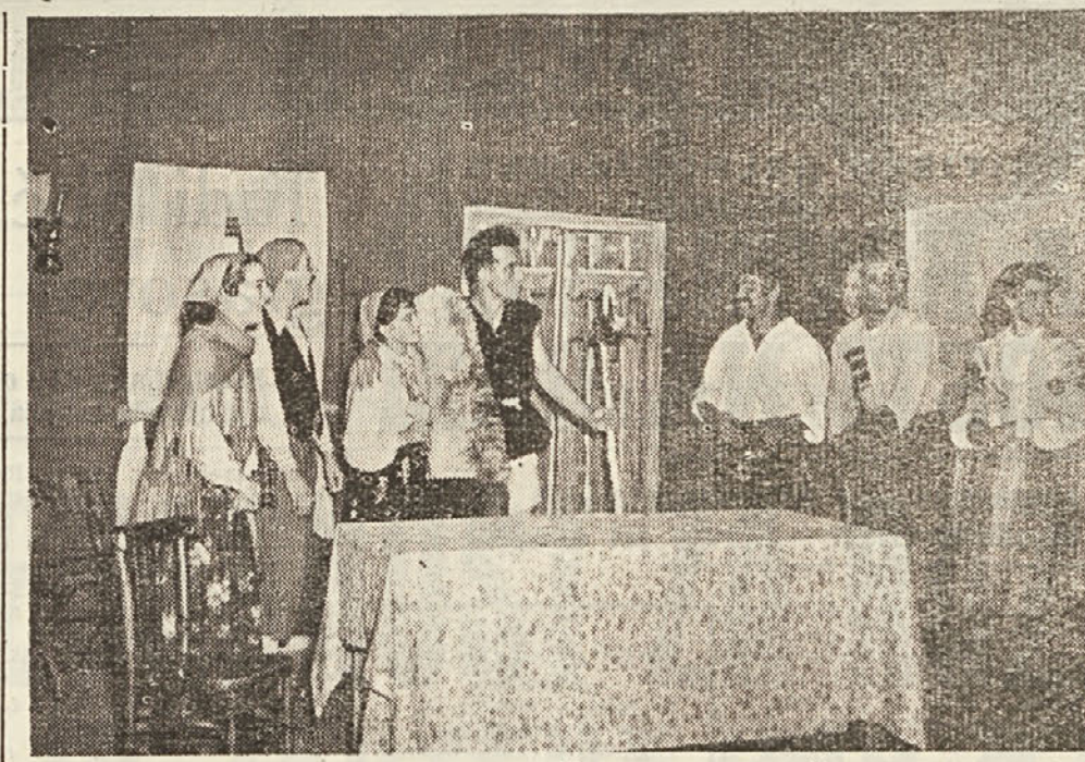
Prizor iz igre v nizavici, ki jo je v soboto 12. t. m. uprizorila v Avditoriju v Trstu gramška skupina kriškega prosvetnega društva v Vesna. Igra je pokazala velike sposobnosti naših kriških diletantov, ki z borbami sredstvi znajo dati lekcije marsikaterim poklicnim igralcem in poklicnim gledališčem z milijonskimi sredstvi. Kriški fantje in dekleta so lahko upravičeno ponosna na svoje uspehe, ki so jih dosegli s svojimi lastnimi močmi. Z nadaljnjim prizadevanjem odlično napredujejo in postanejo ena izmed prvovrstnih dramskih družin v Trstu.

Tudi proslava stoletnice svetovanske šole je naša svoj