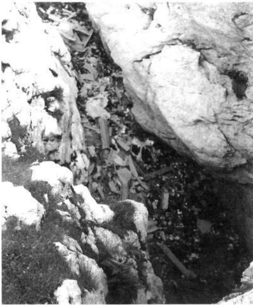
Pod Pogačnikovim domom

levo in ko smo že skoraj pod zimsko sobo, opazimo pod skalami jame, napolnjene s smetmi.