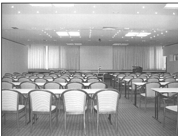
Dvorana Margareta