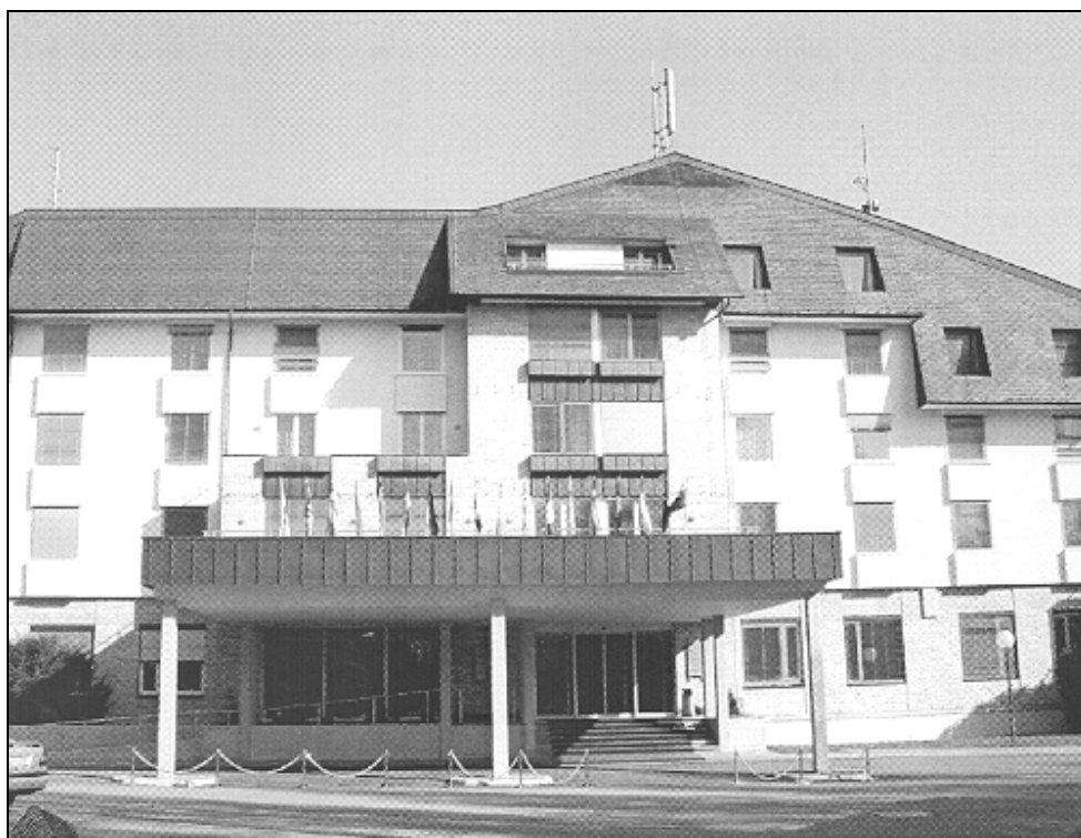
Hotel Kokra

Kot je mogoče razbrati iz prvih razpoložljivih dokumentov, se na začetku objekt omenja kot spremljevalni protokolarni objekt, potem nova kasarna, hotel na kompleksu Kokra, hotel Brdo, na začetku leta 1975 pa se je uveljavilo današnje ime hotel Kokra. Prostorske kapacitete v hotelu naj bi bile namenjene kabinetu predsednika države, policiji, spremljevalnemu osebju in gardi. Poleg apartmajev, dvoposteljnih in enoposteljnih sob ter delovnih, skladiščnih in pomožnih prostorov za osebje hotela, ki naj bi štelo sedemdeset oseb, so bili v objektu za konferenčne namene in sestanke zgrajeni še klubski prostor, dva restavracijska prostora, sejna soba in prostor za odpravno službo. Po pripovedovanju vodje projekta naj bi bil hotel po prvotni zamisli investitorja lociran takoj za današnjim vhodom, po drugem mnenju pa severneje od današnje lokacije, ki torej predstavlja kompromisno rešitev med obema zamislama. Večino zemljišča kompleksa Kokra vzhodno od prvotnega posestva Brdo so pridobili z nakupi in menjavami posameznih parcel. Zemljišče je postalo "bela lisa" v prostorskih dokumentih, kar velja tudi za druge parcele posestva Brdo; kot da jih ne bi bilo. Za izgradnjo hotela v dokumentaciji razen projektov za izgradnjo, nekaterih projektov izvedenih del in izračunov ni ne lokacijskega in ne gradbenega ali kakšnih drugih dovoljenj in soglasij.