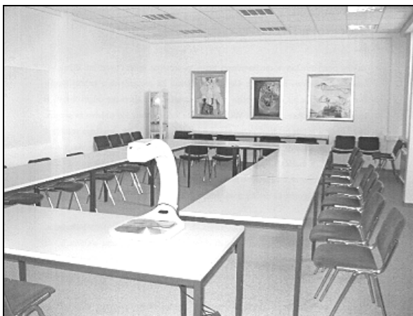
Dvorana Serafina

Vzporedno z zadnjo posodobitvijo in prenovo hotela je začel teči tudi stroškovno in strokovno zahteven ter dolgotrajen in naporen postopek za odpravo "belih lis" v prostorskih dokumentih in za legalizacijo objektov, zgrajenih po letu 1967 na Brdu. Za legalizacijo hotela je bilo potrebno na novo pripraviti celotno projektno dokumentacijo ter temeljito prenoviti in posodobiti čistilno napravo, da sta bili lahko na koncu pridobljeni dovoljenji za uporabo in obratovanje. Sredi leta 2003 je bilo najprej po postopku pridobljeno lokacijsko dovoljenje. Na osnovi projektne dokumentacije, ki jo je izdelal arhitekt Franc Nadižar s sodelavci in ki je vsebovala vse potrebne načrte, soglasja ter mnenja organov in organizacij, je bilo zgodaj jeseni leta 2003 pridobljeno tudi gradbeno dovoljenje. Temu je sledil tehnični pregled objekta in odpravljanje pomanjkljivosti, ki so jih ugotovili posamezni inšpektorji, da je bilo v zadnjih mesecih leta 2003 mogoče pridobiti še uporabno in na koncu obratovalno dovoljenje. Hotel se je s prenovo in legalizacijo izboljšal tako kvantitativno kot kvalitativno. Po kategorizaciji je s treh napredoval na štiri zvezdice.