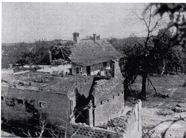
Zadeta lipa ob razdejani hiši

Po uri sodeč, je bilo možno sklepati, da je aprila že tema, kar je tudi kmalu potrdilo prenehanje bolgarskega norenja. Verjetno niso več videli, kam zadevajo njihove mine, ali pa so mislili, da je z Nemci že konec. Tako smo se lahko kot prvo obrisali od prahu in z odej ter mize odstranili odpadli omet ter izpadlo opeko z obokanega stropa kleti. Po izhodu iz kleti tega večera pa smo še ugotovili, da smo zaradi porušenega studentca ostali brez pitne vode, da po dvorišču ležijo mrtve kokoši ter da so v vasi že zgorele ali še gorijo preostale hiše. Z zaseko namazan kruh pa je ta večer pospremil tiste, ki so se ob zatišju podali na že ustaljena dela pri živini in oskrbi našega bunkerja.