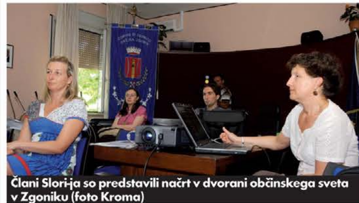
Člani Slorija so predstavili načrt v dvorani občinskega sveta v Zgoniku

ki ga potrebujejo za mlade generacije, ki ga potrebujejo za miselno in čustveno razvedrilo in zabavo. Preživljajo ga lahko aktivno (šport) ali pasivno (gledanje televizije). V obmejnih območjih na izobraževalne, zaposlitvene ter osebne izbire in izkušnje vplivajo tudi procesi čezmejne integracije, ki mladim nudijo dodatne možnosti za izpolnjevanje lastnih življenjskih in poklicnih pričakovanj.