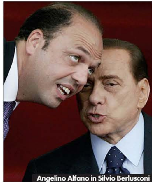
Angelino Alfano in Silvio Berlusconi

Še najbolj je odmeval primer poslanca Nicole Cosentina, čigar odstop z mesta podtajnika na ministrstvu za gospodarstvo (zadevni minister Scajola je, kot obče znano, pred kratkim odstopil, ko je sodstvo razkrilo, da je kupil razkošno stanovanje v Rimu delno z denarjem sumljivega izvora) so formalno zahtevale tri opozicijske stranke (DS, Italia vrednot in UDC) in predsednik poslanske zbornice Fini je že določil datum glasanja o nezau-pnici proti njemu. Po Berlusconi-jevem nasvetu je podtajnik Cosentino sicer odstopil, a ga je Berlusconi potrdil na mestu strankinega koordinatorja v Kampeniji.