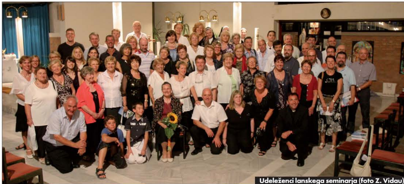
Udeleženci lanskega seminarja

Za Zvezo cerkvenih pevskih zborov iz Trsta pomeni vsakoletni poletni seminar nekakšen višek sezone, saj se z njim sklene letni krog delovanja. Udeleženci preživijo teden dni skupaj ob petju, ogledu kulturnih in naravnih zanimivosti in pogovorih, kar nedvomno povezuje članstvo in nudi obenem priložnost za izmenjavo mnenj ter načrtovanje novih pobud.