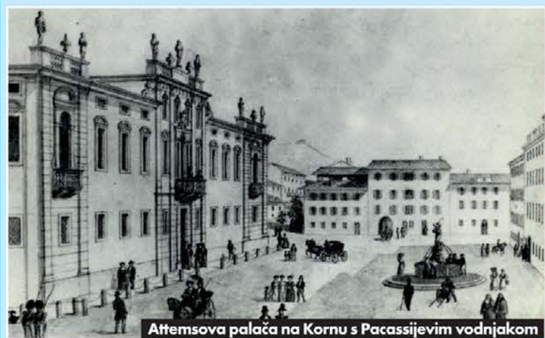
Attemsova palača na Kornu s Pacassijevim vodnjakom