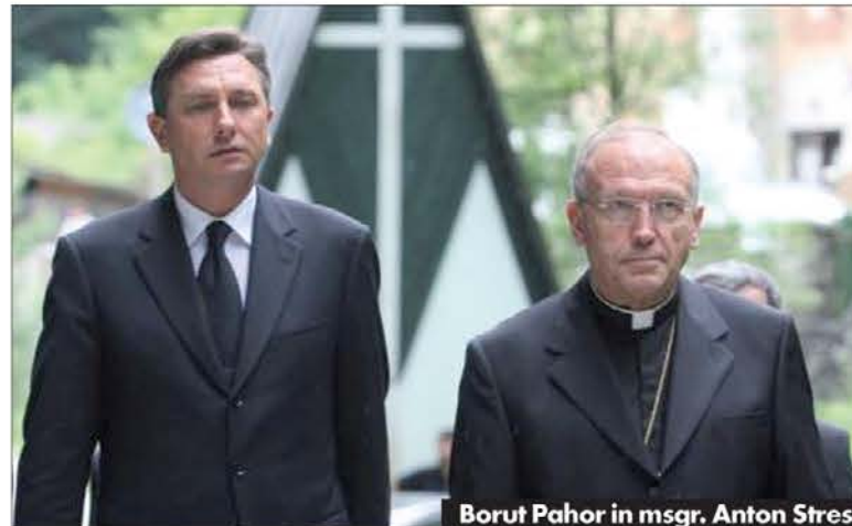
Borut Pahor in msgr. Anton Stres

Tudi nadškof Stres je poudaril dolžnost, da država "tam, kjer to še ni urejeno, tudi na tej točki naredi to, kar vsi čutimo, kar je naša dolžnost". Nadškof verjame, da bo premier naredil vse, da bodo tisti, ki so v Hudi jami končali v strahotnih