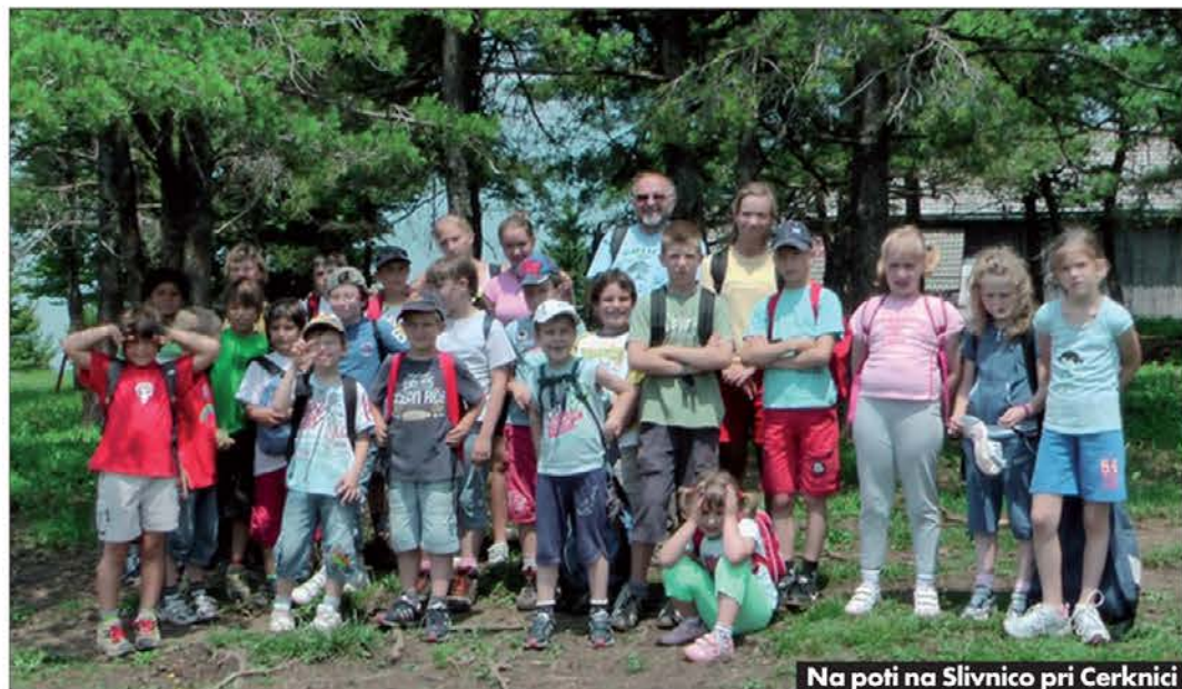
Na poti na Slivnico pri Cerknici