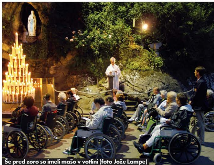
Se pred zoro so imeli mašo v votlini