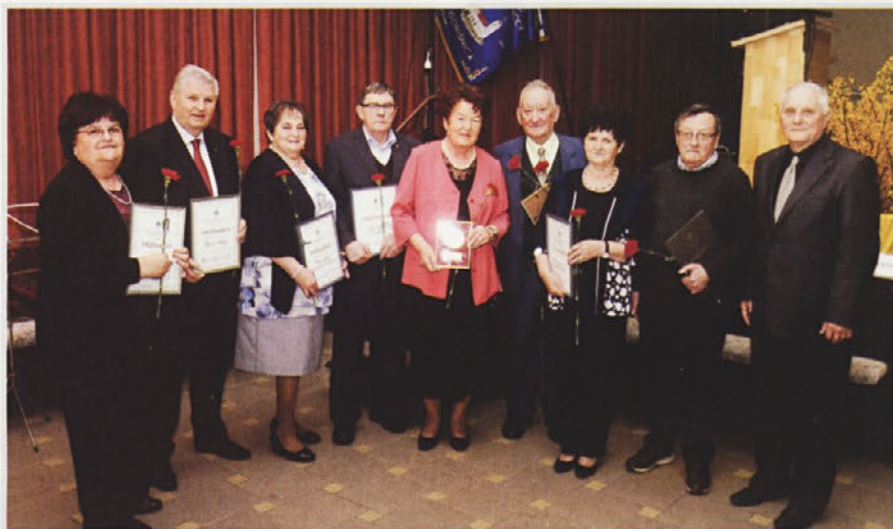
Prejemniki priznanj za leto 2016

Za konec pa še znana misel, ki pravi »Ni pomembno kako dolgo uživaš svoje življenje, ampak kako kvalitetno ga živiš.«