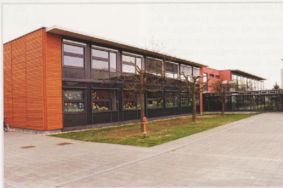
Nova etaža s tremi učilnicami in kabinetom pri OŠ Gorišnica

Občina Gorišnica je objekt 7. aprila 2017 slavnostno predala OŠ Gorišnica v uporabo.