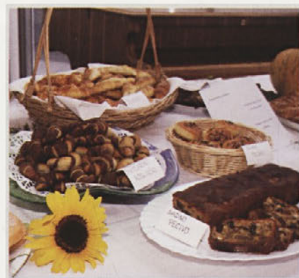
Na razstavi društva gospodinj Gorišnica

Sreča ni v glavi In ne pod palcem zaklad, Sreča je, če se delo dobro opravi In imaš nekoga rad!