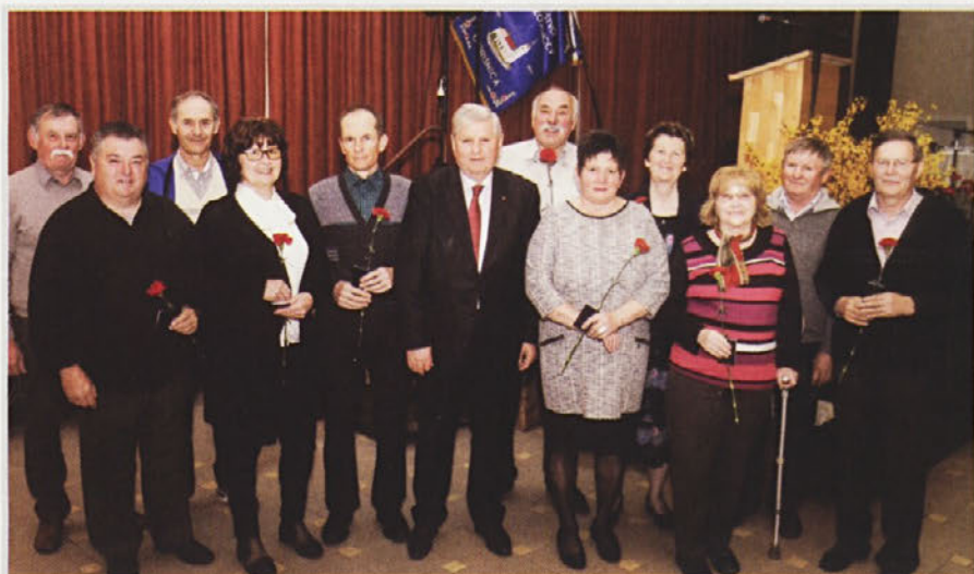
Novi člani DU Gorišnica