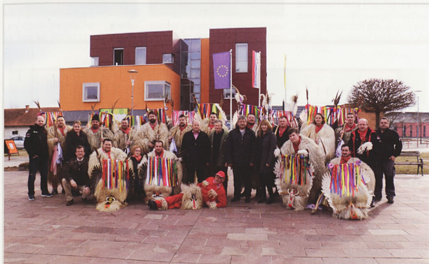
Tudi v letošnjem pustnem času so forminski kurenti predstavili na občinski tržnici.

Naslednji podvig, za katerega se pripravljam, je BALATON ultramaraton, v dolžini 225 km, ki se ga nameravam udeležiti v letu 2017.