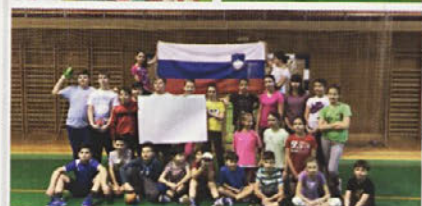
Mladi rokometarji so na natečaju sodelovali s foto in video kolažem