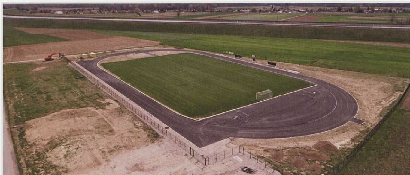
Vizualizacija (zgoraj) in trenutno stanje gradbenih del na novem športnem centru Gorišnica