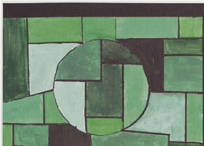
Andraž Kolarič, 5. a