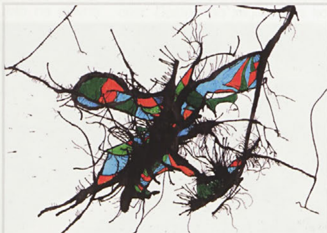
Blaž Kovačec, 7. b