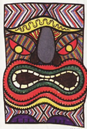
Manca Žunkovič, 5. a