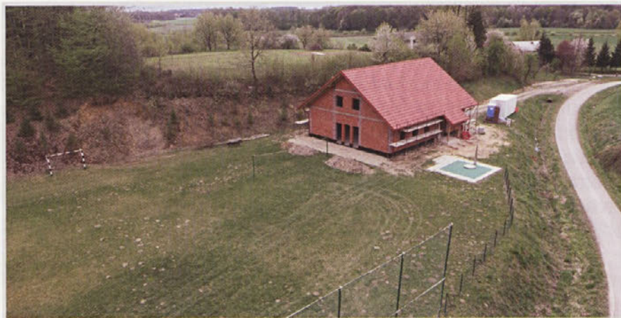
Nov vaški dom Tibolci v izgradnji

Občina Gorišnica je na Portalu javnih naročil objavila Obvestilo o naročilu pod št. objave JN001070/2017-W01, 16. 2. 2017. Na javno naročilo je prispelo 12 pravočasnih ponudb. Po izvedenem postopku preverjanja ponudb je bil kot najugodnejši ponudnik izbran ponudnik CESTNO PODJETJE PTUJ d.d., Zagrebška cesta 49 a, 2250 Ptuj, v višini 425.759,50 € z DDV. Dela se bodo pričela izvajati v maju 2017,