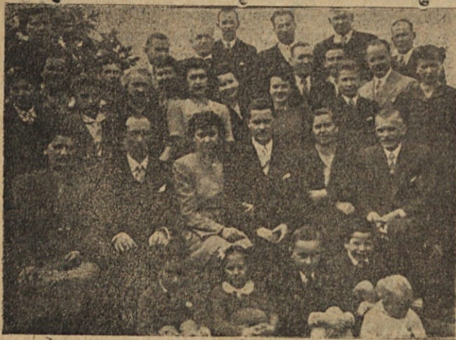
Svatovska družba na ženinovem domu.