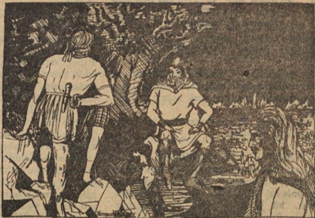
El consejo esloveno no tuvo más remedio y aceptó la batalla impuesta por los antos . . .

Estaba cerca, habría irrumpido entre las jovencitas, asido a Liubíniza, llevado hasta el caballo y huído. Pero algo le enredó los pies, sus rodillas temblaban, sintió un secreto palpitante, las hadas montañesas lo destrozarían si tocara a Li-