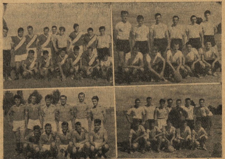
Na sporedu prvega dne IV. športnih dni sta bili dve nogometni tekmi. Slika prikazuje vsa štiri sodelujoča moštva. San Martin nastopa letos prvič in je pokazal, da je zelo resen nasprotnik ostalim ekipam.