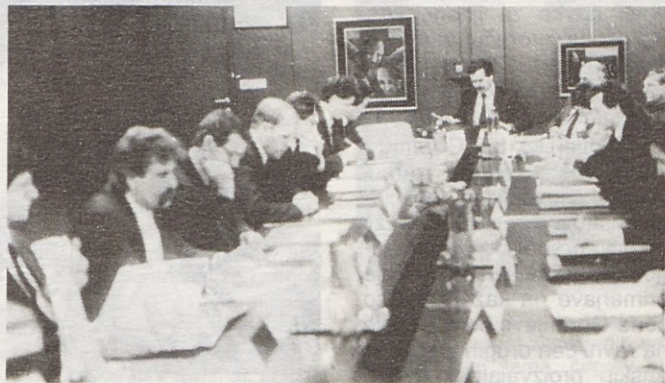
Člani upravnega odbora koncerna Gorenje na seji 26. januarja 1990 v Titovem Velenju.

Upravni odbor koncerna Gorenje je na seji 26. januarja soglašal z uporabo imena Gorenje v dveh novih podjetjih, in sicer Gorenje Delta, ki sta ga ustanovila Gorenje Elektronika in Iskra Delta (Gorenje Elektronika ima v njem večinski kapitalski delež) in Gorenje Družbeni standard, ki je nastalo z izločitvijo tozda Gostinska enota iz Gorenja Gospodinjski aparati in ki bo opravljalo določene storitve za nekatere družbenike koncerna Gorenje.