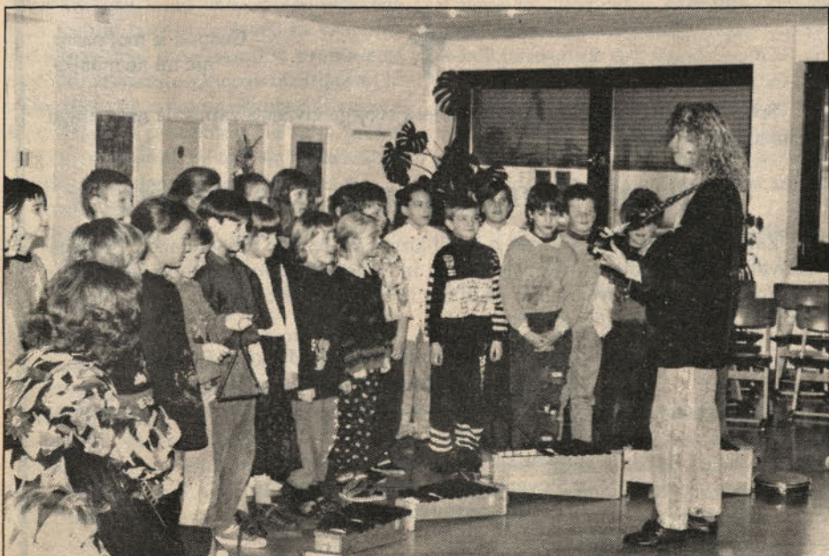
Pozdrav otrok dvojezične šole v Celovcu s petjem.