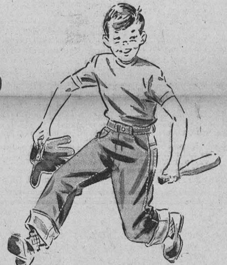
Sanforized Supertuff Dungarees