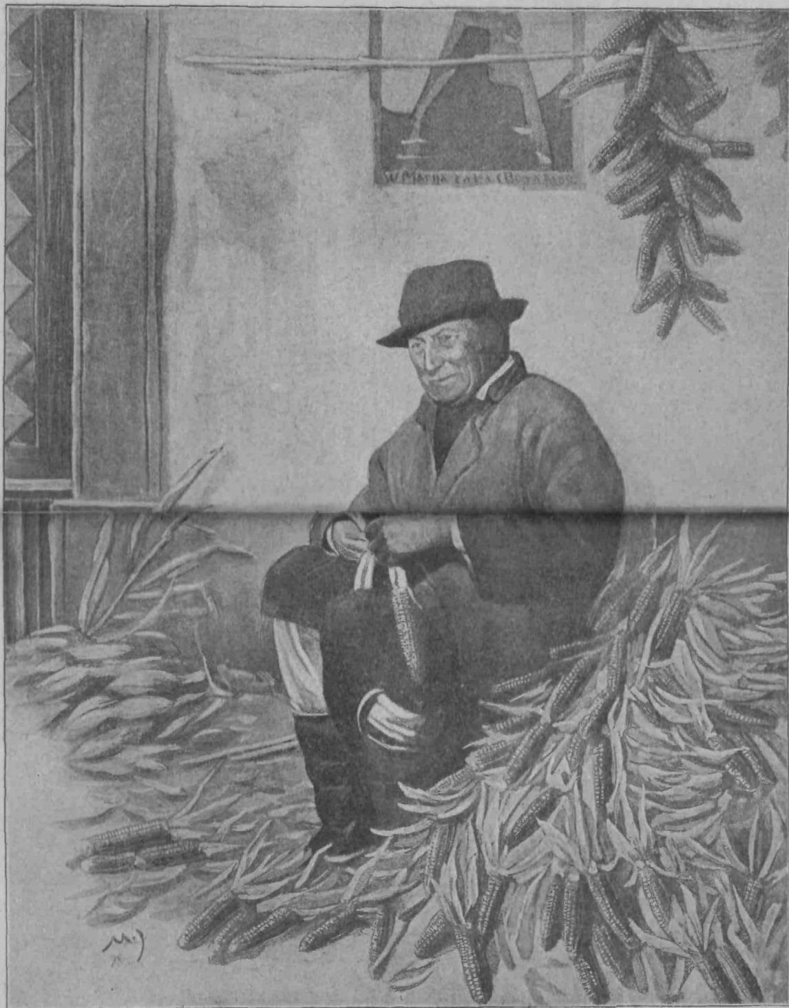
Ob robkanju koruze.