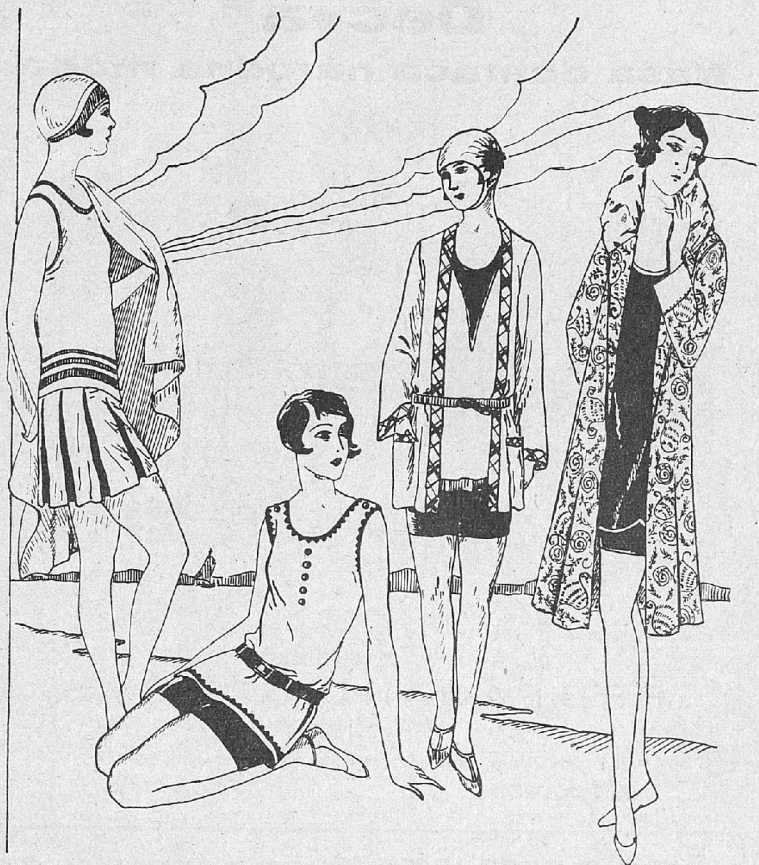
Štev. 30—33. Kopalne obleke iz volnenega trikoja, svile, klota in plašč iz gostega blaga. Kroj za drugo obleko šte. VII. na krojni poli. — Kroj za plašč šte. 33 na krojni poli pod šte. VIII.

Ako si bomo prisvojile vsa ta pravila in še druga, ki jih bomo nadalje objavljali, bomo lahko rekly, da smo res okusno oblečene, če — da, če ne bomo pozabile na glavno pravilo, namreč da je skrajno neokusno za damo in odraslo gospodično kazati po mestu, posebno v popoldanskih urah gola meča!