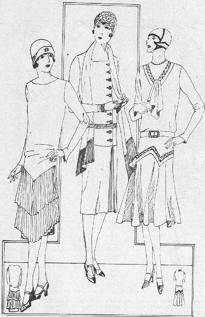
Štev. 4. Poletna obleka iz enobarvnega ali vzorčastega svilenega krepa, z gladkim životom in dvema plištranima volanama na krilu. — Štev. 5. Enostavna obleka iz platna ali surove svile. Krilo ima samo na levi strani skupino precej globokih zlikanih gub. Bluza je enostavna, se zapenja ob strani z velikimi rdečimi gumbi, rdeč pas in našivek ob zapestju. Krilo je prišito na bluzo. — Štev. 6. Platnena ali svilena obleka z vezeno, pisano borduro in zvončasto ukrojenim krilom.