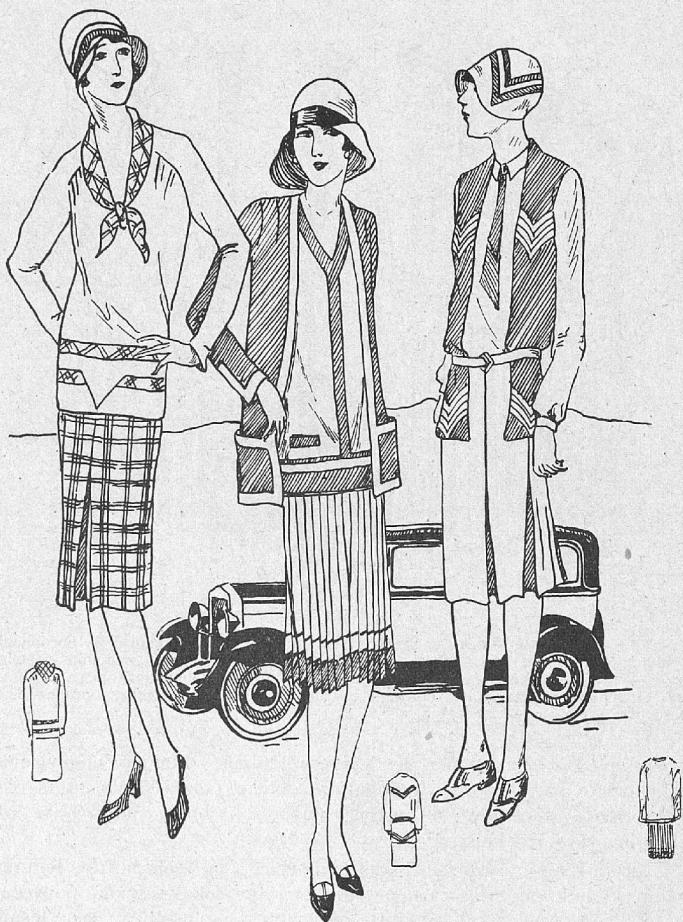
Štev. 14. Športna obleka s kariranim krilom in enobarvno bluzo, okrašeno s kariranimi pasovi in šalnim ovratnikom. — Štev. 15. Dvobarvna športna ali predpoldanska obleka s kratko odprto jopo. — Štev. 16. Bela platnena športna obleka z rdečo, modro ali svetlo zeleno jopico brez rokavov. Kroj I. na krojni poli.