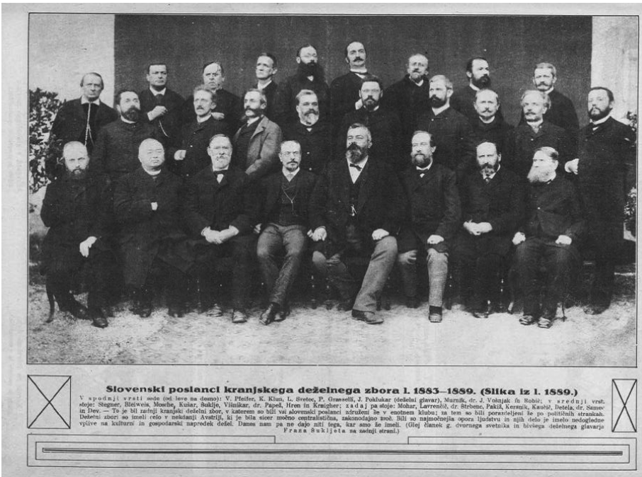
Slika 1: Slovenski poslanci kranjskega deželnega zbora 1889.