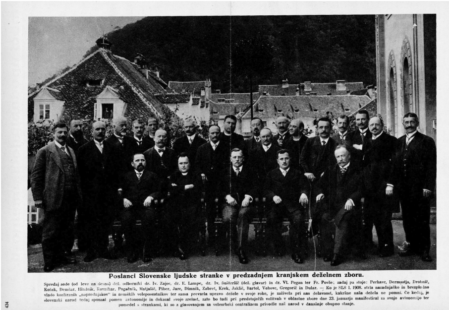
Slika 2: Poslanci Slovenske ljudske stranke v letih 1908–1913.