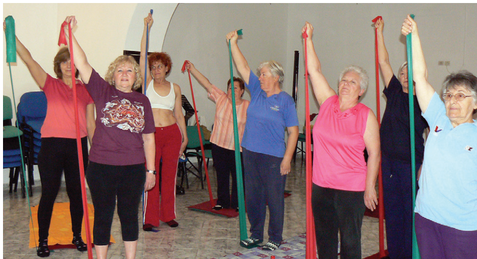
Punce v akciji