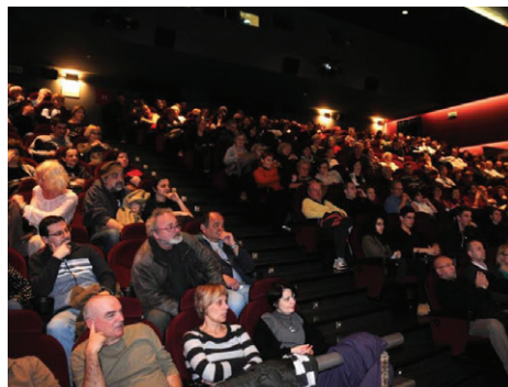
Na predvajanju filma Čefurji raus!

Lani je izšla njegova druga knjižna uspešnica Jugoslavija, moja dežela. Filmska upodobitev njegovega pisateljskega