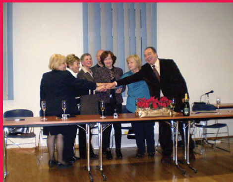
Podpisovanje koordinacije v Poreču