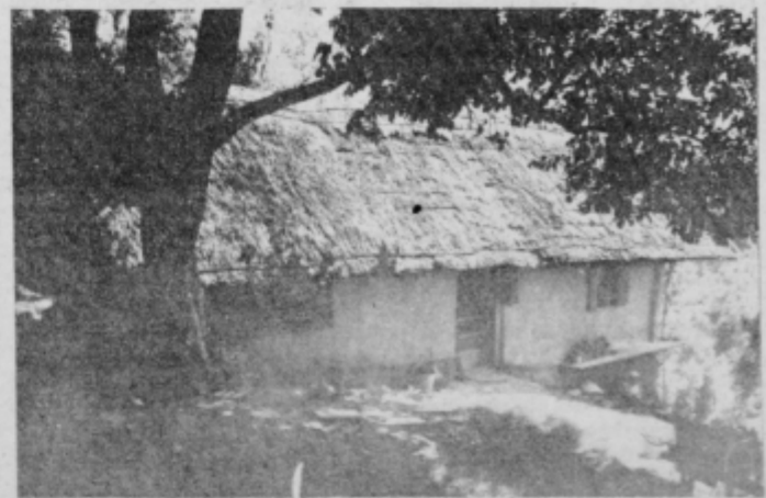
Haloška domačija na Belskem vrhu