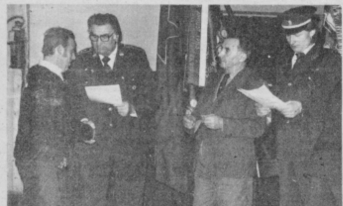
S sobotnega stotega občnega zбора GD Lovrenc na Dravskem polju.