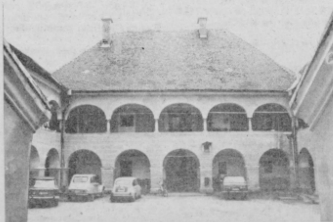
Nekdanja Ullmova graščina v Zavrču