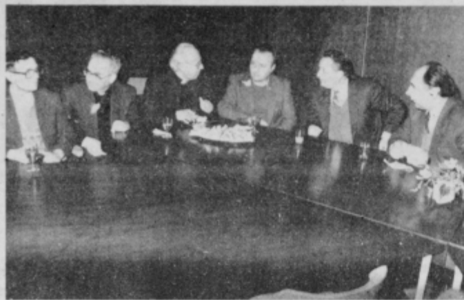
Razgovor po uradnem srečanju

Po uradnem srečanju so se predstavniki družbenopolitičnih organizacij in občinske skupščine zadržali še v razgovoru in izmenjali stališča do posameznih vprašanj.