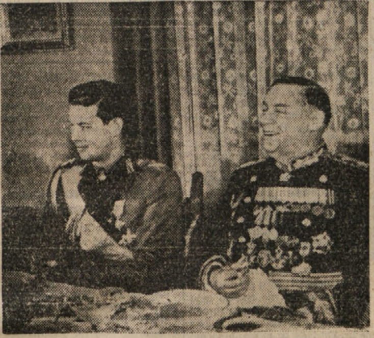
Romunski kralj Mihail je nedavno privedel svečeno kobilu na čast sovjetskemu maršalu Tolbuhinu. Na sliki vidimo mladega kralja z visokim gostom.

Wierblowski je odgovoril, da ponovno politično raztelesenje Nemčije ne bi bilo praktično in da bi bilo kratkotrajno. Zdržljivo gibanje je nastalo v decentralizirani Nemčiji. Nevarnost Anschlussa bi bila večja, če bi bila decentralizirana Nemčija, v katero bi Avstrija lahko vstopila kot neodvisna država. De Murville je omenil, da je v nemarska republika bila združena in da bi združena Nemčija predstavljala zdaleka večje privlačno sredstvo. Wierblowski je pojasnil, da ni nameraval govoriti o strogo združen ali centralizirani Nemčiji, toda ima raje centralizirano kakor pa federalizirano državo. Francoski delegat je omenil, da ni govoril v izrazih likvidacije ali raztelesenja Nemčije. Ko je odgovorjal ameriški delegat Robertu Murphyju, je Wierblowski dejal, da njegova vlada ugotavlja gospodarska dobrobitja ozemlja, ki so odvzeta razdejani, ki jih je povzročila vojna. Drugi poljski delegat Stanislav Leszcynski je izjavil Murphyju, da je celotno prebivalstvo novih ozemelj, vseh tistih del Vzhodne Prusije, ki je zdaj pod poljsko upravo, dosegalo po nemških statističnih izvešilih 8 milijonov 800 tisoč oseb. 1. novembra 1946 so prebravali devlo prebivalstva na 5.083.000. Prebivalstvo je nato naraslo na 5.100.000.