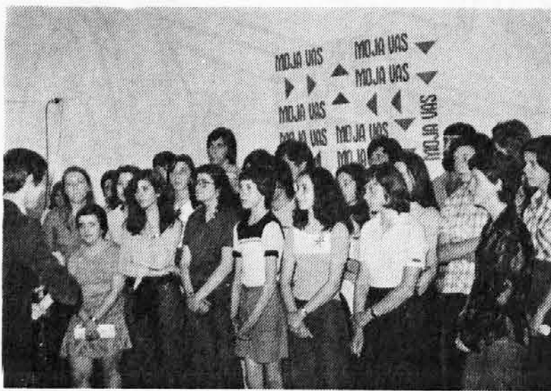
Pevski zbor «Pod lipo» iz Barnasa je prav lepo pel na konkoršu «Moja vas»