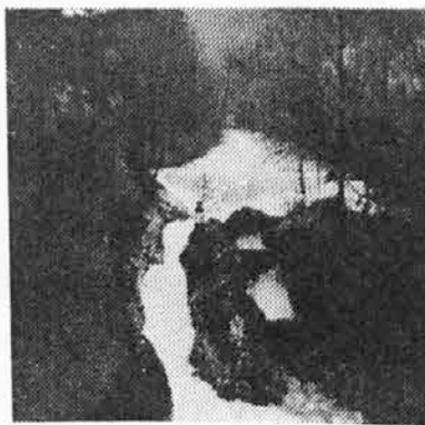
Povodnja na Lesah.