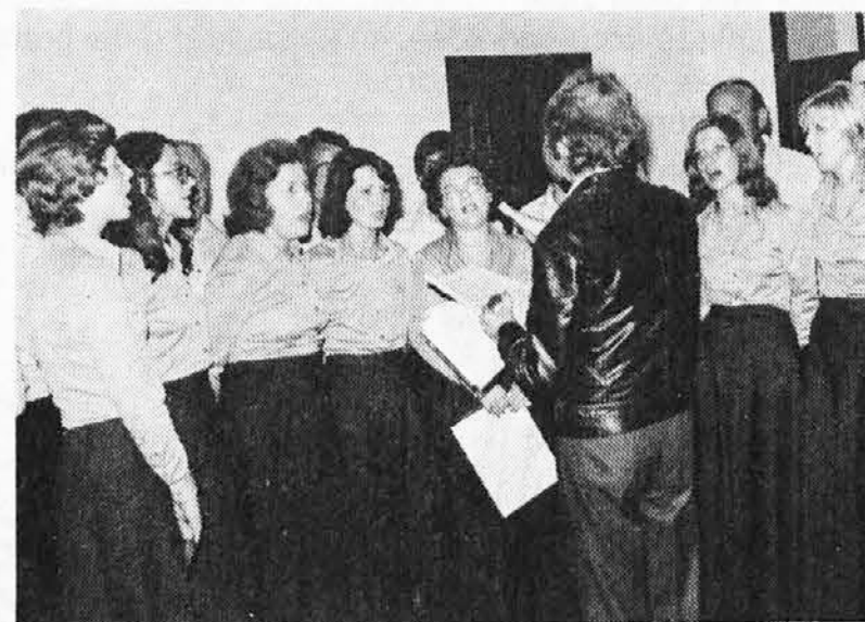
Pevski zbor «Rečan» nastopa na vseh kulturnih manifestacijah. Tudi v Špetru je imel velik uspeh (Šučes)