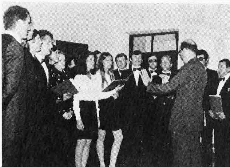
Dosti aplavzov je odnesel pevski zbor iz Sv. Lenarta, ko je nastopil v petek zvečer v Špetru