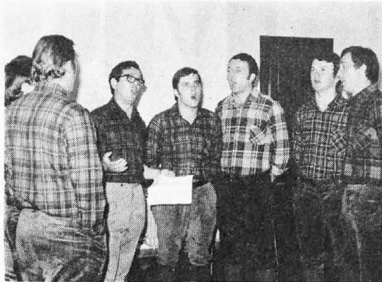
Na konkoršu «Moja vas» niso smeli manjkati «Nediški puobi», ki so ubrano zapeli