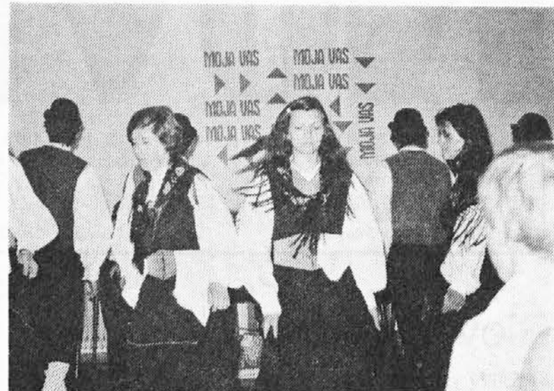
Rezijanska folklorna skupina je odnesla iz Špetra največ aplavzov