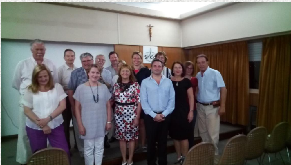
Del publike ki se je udeležila zadnjega »prazničnega« večera ...

Okusen prigrizek je dopolnil prijetno in doživeto srečanje, s katerim je SKA zaključila svoje delo v letu 2017.