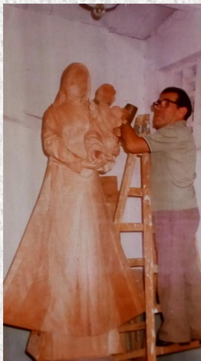
Dela mojstra Žirovnika