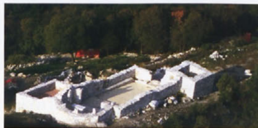
Obnovljene ruševine cerkvenega kompleksa na Sabotinu