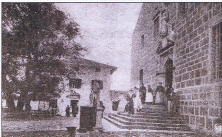
Sveta Gora - okrog 1900