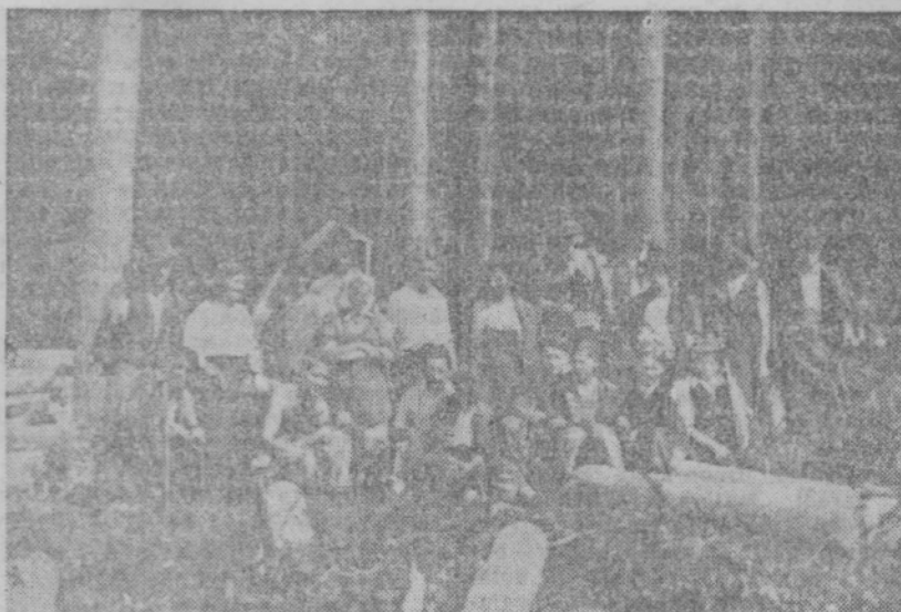
Brigada v Slovenjgradu po končanem delu