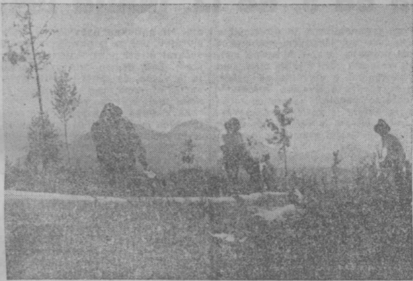
Pri merjenju hlovov

počitimo. Hrana je odlična, imamo vsaki dan meso, kruha je dovolj. Paščica sovražnikov, ki živi med vrstami našega ljudstva, bo prišla danes ali jutri na svoj račun. Med nami je dosti zvestih brigadirjev, ki so se javili, da ostanejo po tri mesece v akciji. To so večinoma kmetijski delavci (hlapci), ki so vse življenje garali od jutra do mraka in bili brezčutno izkoriščani od gruntarjev. Mladina, javi se v čim večjem številu v gozdne brigade. Čim več nas bo, tem prej bo izvršen naš petletni plan. Veak bor in smreka, ki padeta v naših gozdovih, nam pomagata bližje k socializmu. (Nadaljevanje na 2. strani)