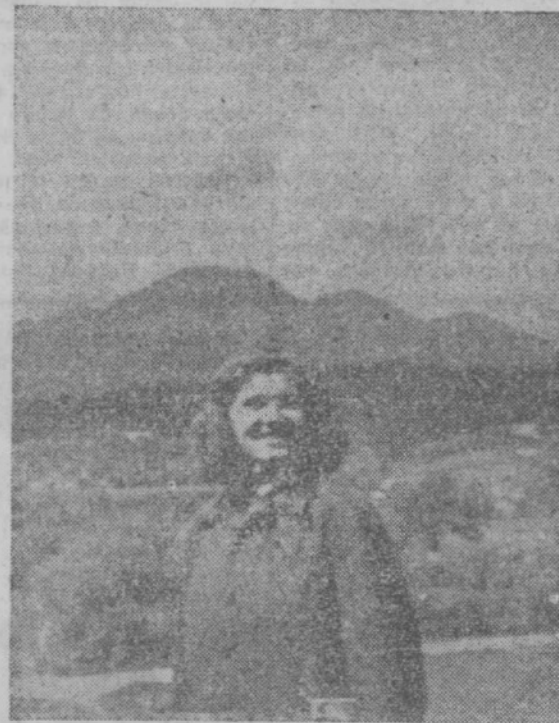
Tov. Kidričeva je komandant brigade v Slovenjgradu

Izkušnje prvih brigad bodo dobrodošle novim brigadam, ki odhajajo na področje mariborske in slovenjgraške gozdne uprave.