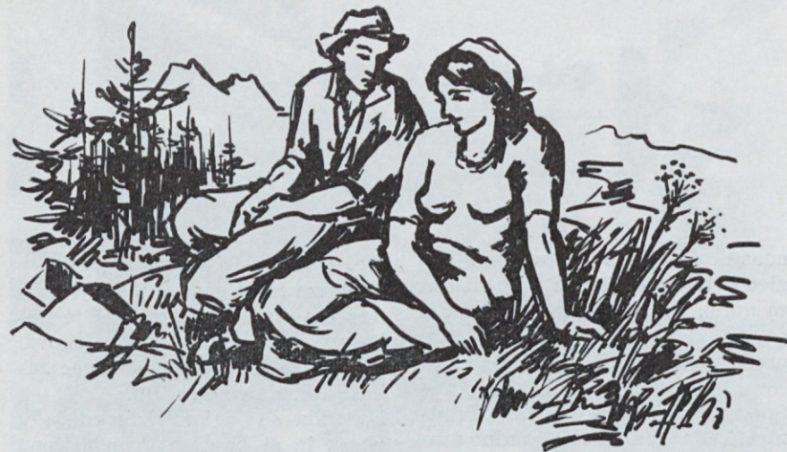
Potem sta odšla na obrobje pečevja in sedla

domislili, saj je s poniževanjem prignal prav do konca.