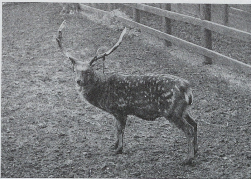
Sika jelen ( Cervus nippon ) je v številnih podvrstah razširjen v Vzhodni Aziji. V SZ ga zadnja leta naseljujejo tudi v evropskem delu države

Kako nevšečne in dalekosežne posledice na biocenozo ima popolno zatrtje velikih mesojedov, zlasti volka, je v svojem referatu prikazal J. V. Kostin iz krimskega