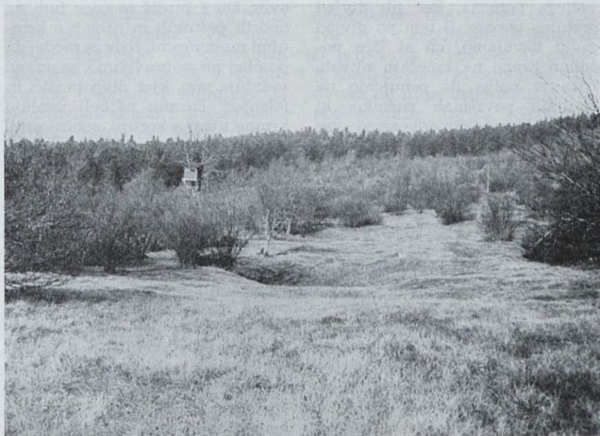
Takšna mesta preuredimo v dober pašnik z močnim gnojenjem in košnjo

Mesto za osnovanje krmnih njiv in pašnikov mora biti skrbno izbrano. Najbolje je, če so polja za divjad razporejena po vsem lovišču. Kjer pa želimo s krmnimi njivami preprečiti škode v določenem delu lovišča, jih osnujemo zlasti tam. Njive in pašniki za divjad morajo ležati na izstopnih mestih in morajo biti dovolj oddaljene od drugih njiv; sicer z njimi ne preprečimo škode, ki jo povzroča divjad kmetijstvu. Dobra mesta so predvsem gozdne jase in opuščena kmetijska zemljišča blizu ali sredi gozda. Upoštevati moramo tudi možnost dostopa z vprego ali traktorjem in da je zemlja