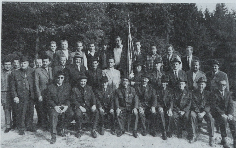
Člani LD Zagorje ob Savi

Pri roparicah ima prednost lisica, kar je značilno za hribsko lovišče. Težko pa jo je držati na kratko zaradi prepovedi uporabe cianovodikovih ampul. Od drugih dlakastih roparic pridejo v poštev še podlasica, dihur, hermelin in tudi kuna zlatica. V dolgih presledkih pride na obisk divja mačka. Tako je bilo tudi letos januarja. V dolini blizu vasi Kotredež je izpraznila kokošnjak do zadnjega kljuna, kar pa je morala plačati s svojim kožuhom. Od ujed so zastopane kragulj, kanja in skobec, ki pa niso tako številne. Ker so vse roparice sestavni del favne, bodo pač še nadalje obstajale, treba jih bo le držati v šahu. Hiše rastejo kot gobe po dežju; nastajajo cele naselbine in vasi. Zaradi tega se krči površina lovišča na škodo divjadi. Poseben problem je v jugovzhodnem predelu lovišča. Tu se useda na rastlinje prah iz cementarne in termoelektrarne v Trbovljah, ki negativno vpliva na rastline, njihovo rast in prehrabeno vrednost. Opazni so pogosti primeri nenaravne obrabe zobovja pri srnjadi zaradi prahu na rastlinah. 31. avgusta 1969 je tukajšnja družina slavila novo