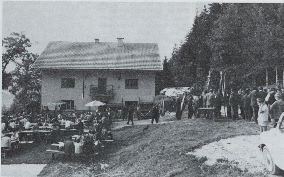
Lovski dom LD Zagorje ob Savi

pomoč SO Zagorje, ki je dotirala znesek za nakup cevi iz sklada za male asanacije. Nadalje je bila na vrsti 800 m dolga cesta skozi gozd. Treba je bilo podreti drevje, razstreliti korenine, z buldožerjem razorati traso in napeljati grušč za utrditev terena. Pri tem je pomagalo gozdno gospodarstvo z dovozom grušča. Dostop do doma je omogočen za vsa motorna vozila.