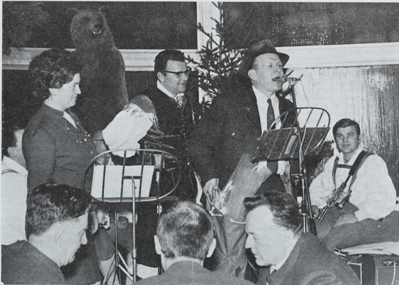
Žrebanje nagrad »Lovčeve« križanke na lovsko-kinološkem plesu