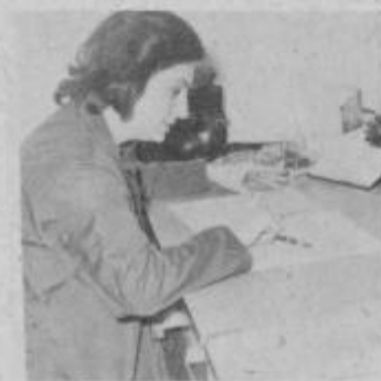
Korektorica v spopadu s tiskarskim skratom.