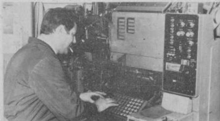
Delo pri stroju za strojno postavljanje črk.

„ali je tiskar v pravem pomenu besede še sploh potreben“. Počasi bo ta poklic nadomestil kompjuter. V nekaterih laboratorijih grafične umetnosti se tiska s hitrostjo 914 metrov v minuti s pomočjo elektrostatičnega procesa. Papir teče med dvema nasprotno usmerjenima električnima poljema in pod elektronskim oblakom tiskarske barve, ki se nahaja med obema električnima poloma. Barva se nanaša na papir s pomočjo posebne sitaste matrice, narejene iz kovine, ki služi kot nekakšna elektronska mrežica pri radijskih in TV elektronkah. Elektrostatična metoda tiska bo v komercialni rabi verjetno v