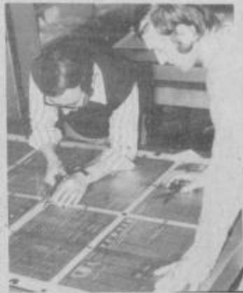
Montažerji pri delu.

Tipotisk je proces, ki je nasproten gravuri. Njegov odtis gre po podobnem postopku, kot če odtisemo navaden gumijasti pečat. Odtis na papirju opravijo izbočeni deli tiskarske ploskve. Ta oblika, ki je le nekoliko izpopolnen Gutenbergov patent, je danes največ v rabi v tako imenovanih starih tiskarnah široke potrošnje, kajti offset je dobil