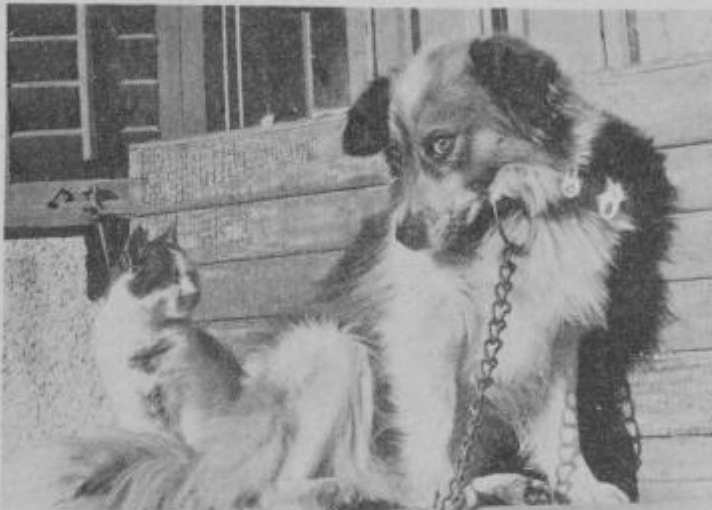
Neverjetno, vendar resnično — dva velika sovražnika sta tokrat prava prijatelja.