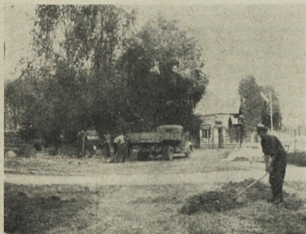
Dela pri asfaltiranju dvorišča

Ugotovljeno je bilo, da pride do plesnive preje zato, ker uporabljajo v vlagalnici ročno škropilnico namesto stroja za vlaženje, katerega smo nabavili v te namene. Do zmečkanih kopsev pride zaradi premajhnih košar, vendar se taki kopsi v vlagalnici ne bi smeli