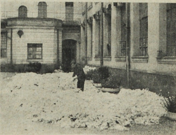
Očuvani bombaž iz celice št. 9, ki je bil prenešen na dvorišče zaradi sušenja