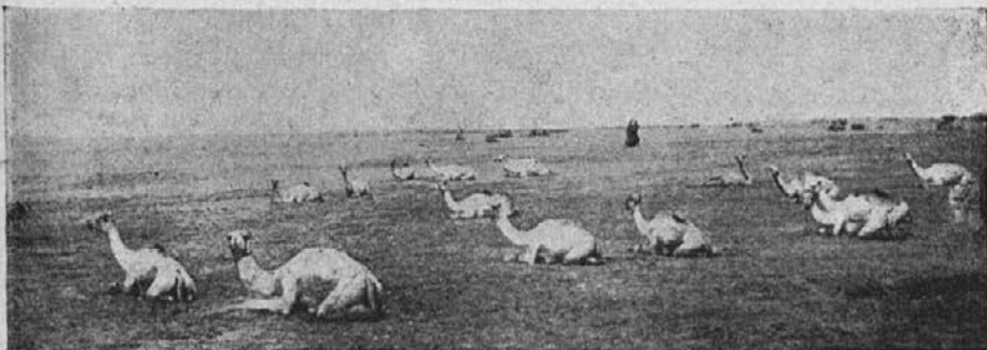
Kamele počivajo — puščava Sudan

bi trenila s trepalnicami. Vodnjak mora biti zelo globok, če hoče tudi žejna karavana dobiti svoj delež v njem.