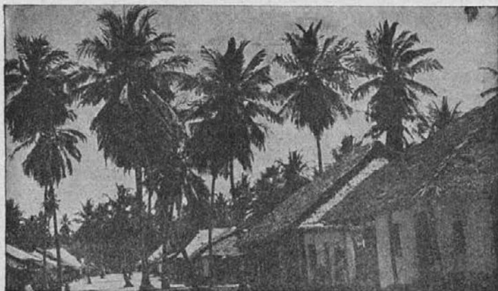
Zamorska vas v Tangi

podzemlje k našim prednikom. In je takoj odhitel k čarovniku.«