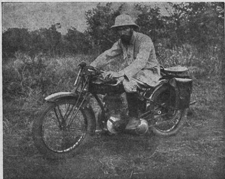
Na apostolskem potovanju

Čeprav so časi težki, vendar misijonsko življenje gre tu po navadnem tiru. Delo po postajah lepo napreduje. Zidanje pa smo morali povsod ustaviti. Štedimo kar se dá, da bi vzdržali čim dlje.