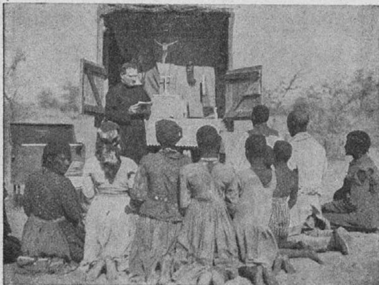
Sveta maša na prostem

zato upamo, da bomo mogli to veliko delo dovršiti. Tudi smo prepričani in upamo, da nas bo Vaša družba podpirala.