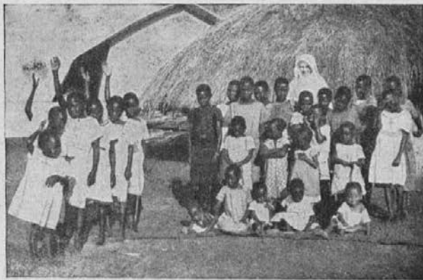
Zamorčki pod materinsko oskrbo misijonark