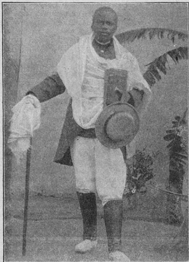
Zamorski katehist — desna roka misijonarjeva