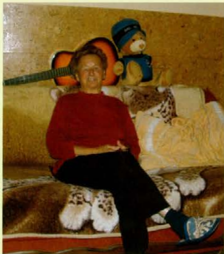
Terezija se je nekoč ukvarjala z vzrejo pujskov

Kmetija ima 17 hektarov površin, od tega je