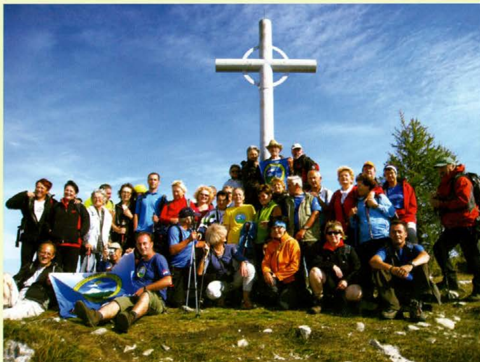
Celotna skupina na vrhu Uršlje gore