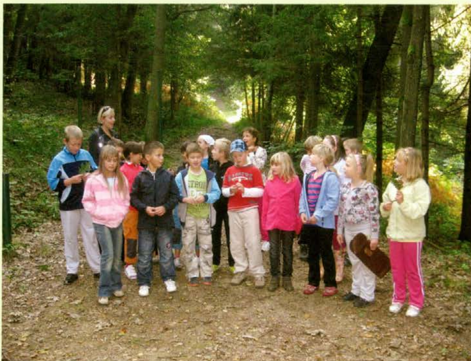
Tretješolci ravske OŠ Prežihovega Voranca na Gozdni učni poti Navrški vrh

predlagana Gozdna in zgodovinska turistična pot Stari grad Radlje ob Dravi, predlagatelj Občina Radlje ob Dravi, v Mestni občini Slovenj Gradec Pot Rimljanov, predlagatelj Domačija Polanar, Gozdna turistična pot Plešivec, predlagatelj TD Slovenj Gradec, Pot na Rahtelov vrh, predlagatelj TD Slovenj Gradec, Meškova pot, predlagatelj TD Murn Sele-Vrhe, in v občini Vuzenica Gozdna pot »Pistrov grad«, predlagatelj Občina Vuzenica. Komisija za ocenitev