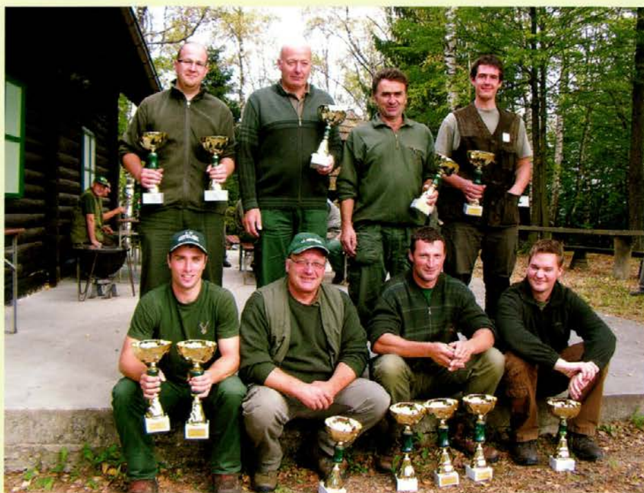
Prejemniki pokalov za dosežena najvišja mesta