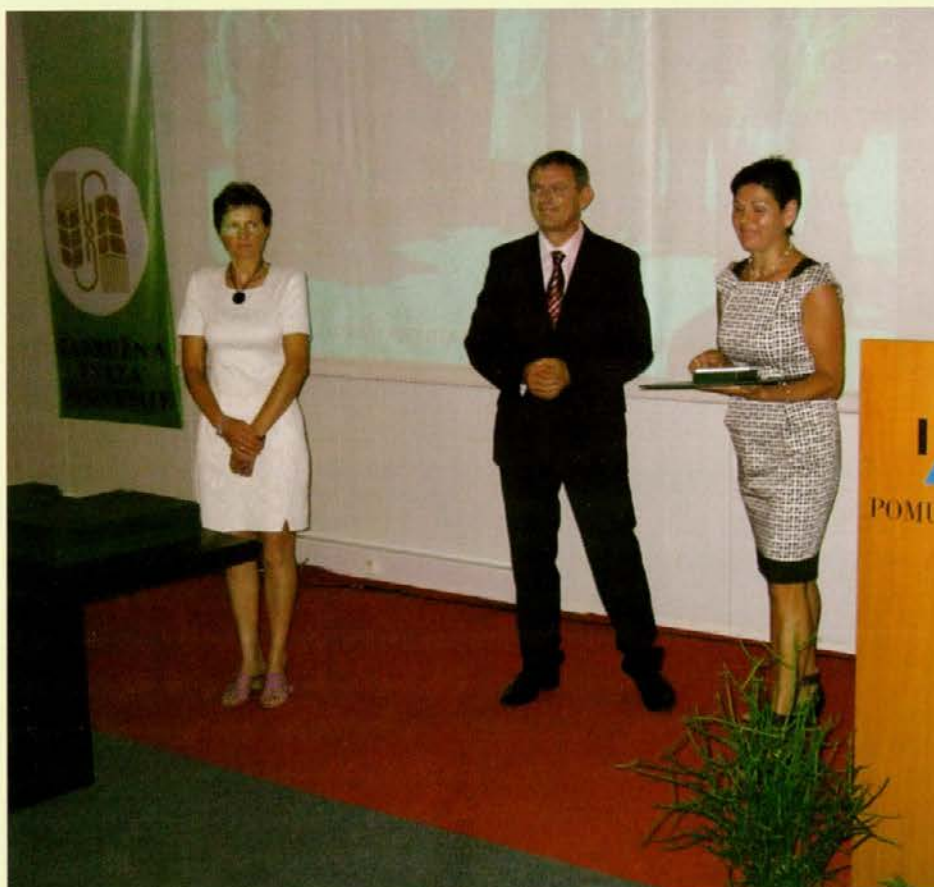
Svečana prireditev ob Radgonskem kmetijsko-živilskem sejmu