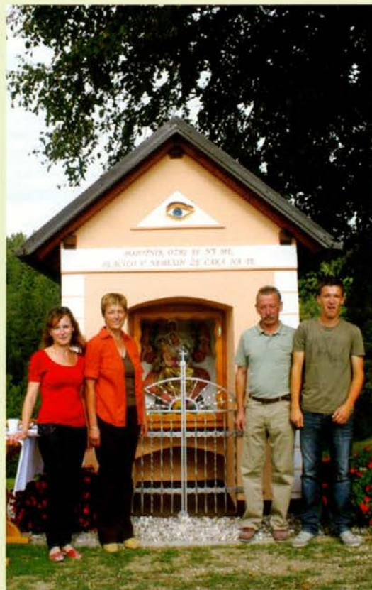
Pred obnovljeno kapelo

Ko se boš, popotnik, ustavil na križpotju pod lipo ob kapelici z lepim razgledom na Paški Kozjak, Graško goro in Pohorje, se zamisli, ko boš prebral napis: »POPOTNIK, OZRI SE NAME, PLAČILO V NEBESIH ŽE ČAKA NATE.«