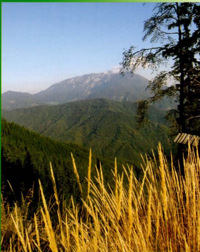
Pogled s Smrekovca proti Peči

Po pregledu semenskih objektov in ocenitvi semenskega obroda smo se gozdarji javne gozdarske službe dogovorili o nabiranju