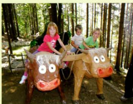
Volovska vprega pred jezerom

Ure so minevale kot minute, mali škrtaki so se okrepčali s kuhanim krompirjem ali palačinkami, pa tudi za nas ostale se je pričaralo nekaj zelo dobrega. Na hiški je bilo treba samo še urediti podrobnosti, pritrčiti našo zastavo, dodati vse okrasje in je bila nared. Naša posebna vrtčevska