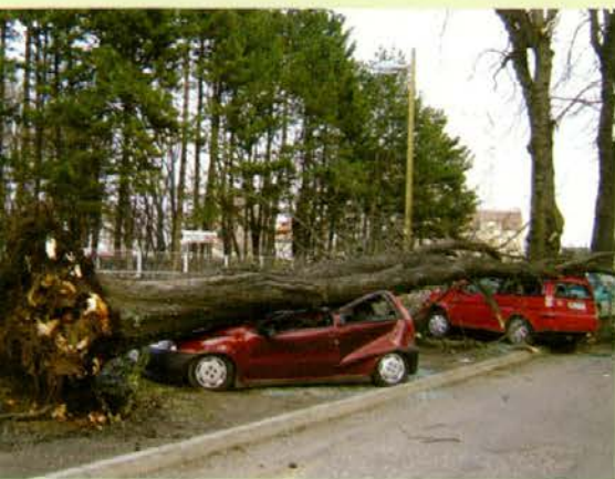
Po dolgih letih brezobzirnega parkiranja na koreninah dreves je drevo omagalo. Če mu uničimo "noge", ne more več stati ...

S skrbjo za drevesa v gozdu se ukvarja gozdarstvo oziroma gozdarski strokovnjaki. In tudi narava sama. Tam je življenjska