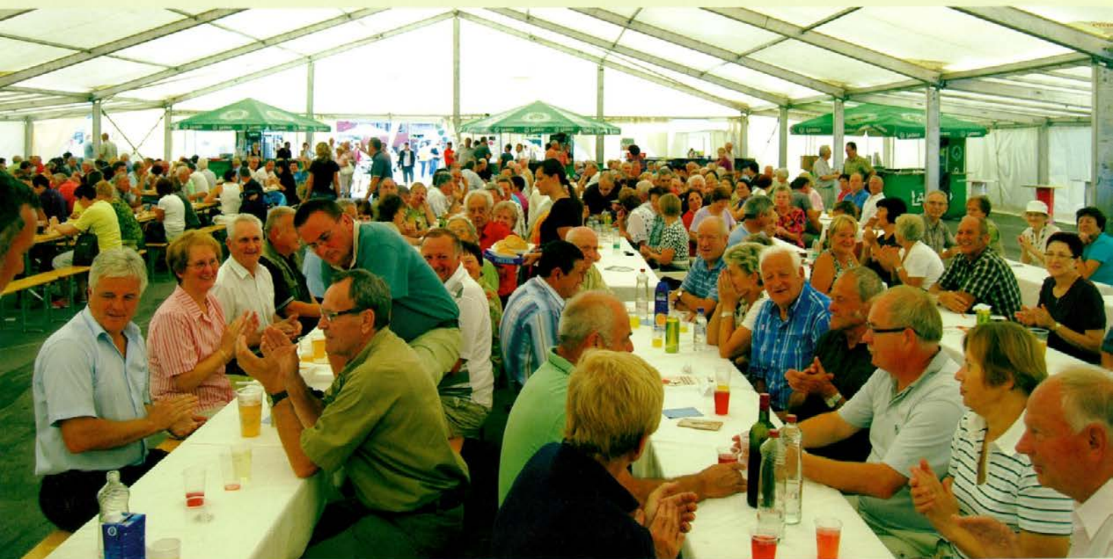
Upokojenci na srečanju na Prevaljah