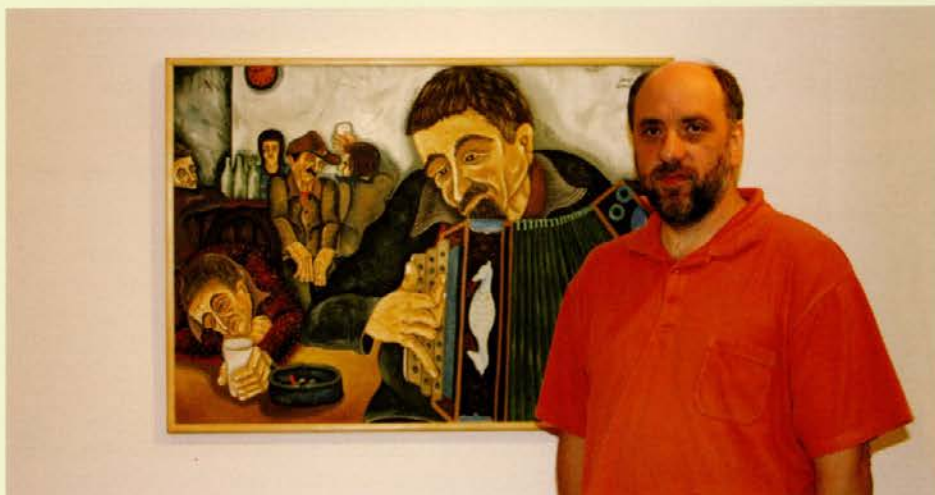
Janez Repnik slika ljudi »z roba«

Prvo samostojno razstavo je imel leta 1984 v Starem trgu pri Slovenj Gradcu v Kulturnem domu. Odziv ljudi na njegova dela je bil pozitiven, kar ga je motiviralo, da je slikal naprej. Takrat še ni imel izoblikovanega sloga in se je bolj nagibal k likovnemu slogu očeta. Svoj slog, ki ga kritiki imenujejo socialni ekspresionizem, si je izoblikoval pred 25 leti, temu pa je botrovala tudi izguba službe. Slika ljudi z roba, s tem pa opozarja na bridkost