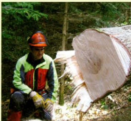
Kljub filigransko natančnemu delu rezultat ni vedno idealen