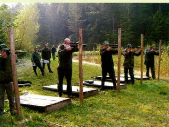
Tekmovanje z MK-puško

V okviru praznovanja praznika Občine Radlje ob Dravi je bilo tudi letos septembra že 9. tradicionalno srečanje lovskih družin, ki imajo lovišča na ozemlju omenjene občine. Župan Občine Radlje ob Dravi Alan Bukovnik je ob tej priložnosti pozdravil številne zbrane lovce in se jim zahvalil za prispevek k obogatitvi programa praznovanja občinskega praznika, LD Remšnik pa je za organizacijo tega srečanja izročil zahvalno listino.