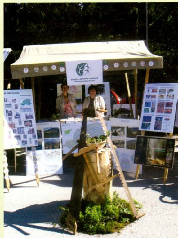
Na državnem prvenstvu gozdnih delavcev je predstavil svoje aktivnosti tudi ZGS

V letošnjem letu - Mednarodnem letu gozdov - poteka tudi izbor najboljših urejene tematske poti v Sloveniji. Ta pot bo izbrana iz skupine 14 najboljših regijskih tematskih poti (OE Zavoda za gozdove Slovenije). Rok za prijavo »naj poti« v posameznih območjih je bil 20. september 2011. V OE Slovenj Gradec je bilo prijavljenih na razpis 6 tematskih poti. V občini Radlje ob Dravi je bila