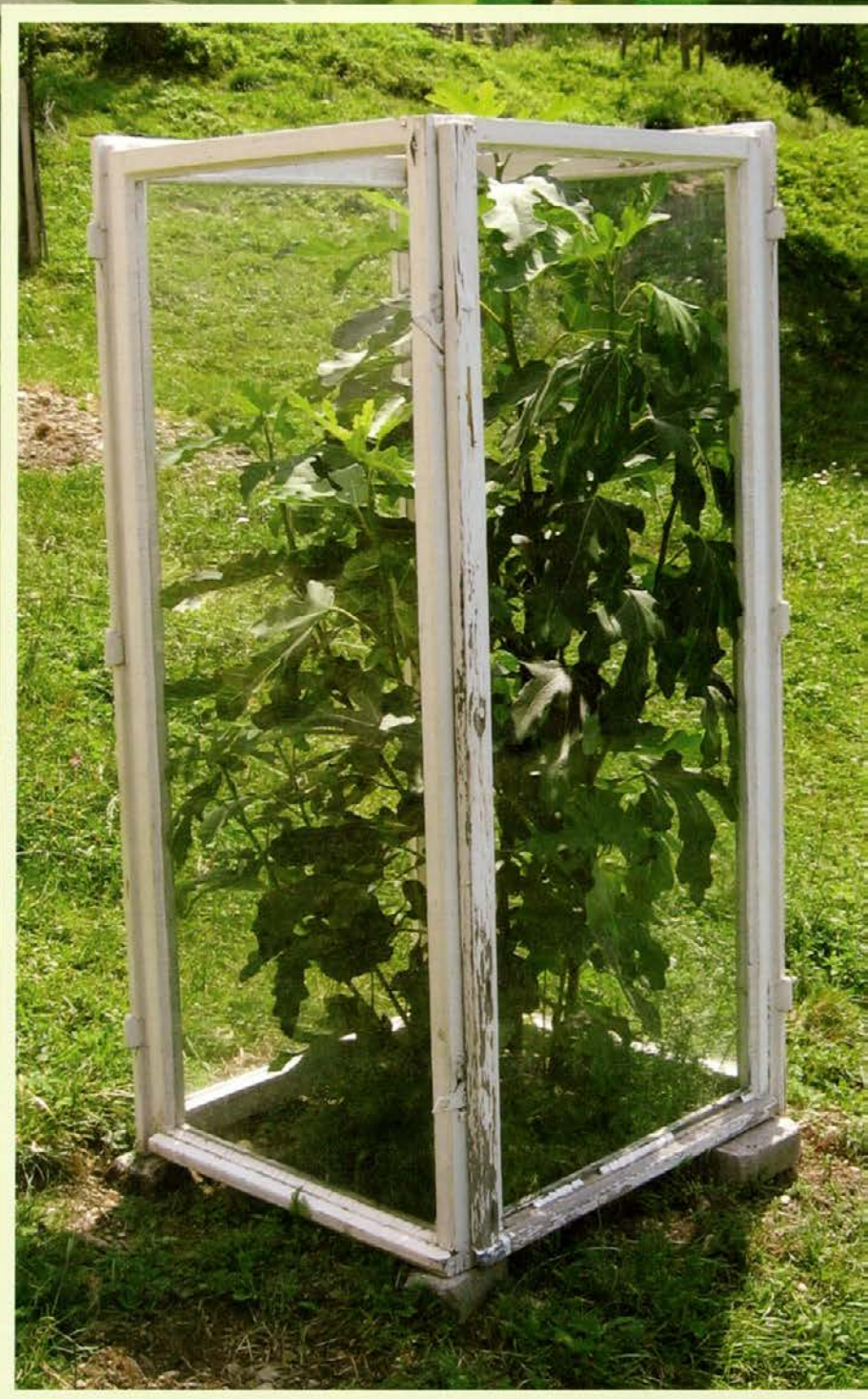
Šilerjeva figa na Kozjem vrhu