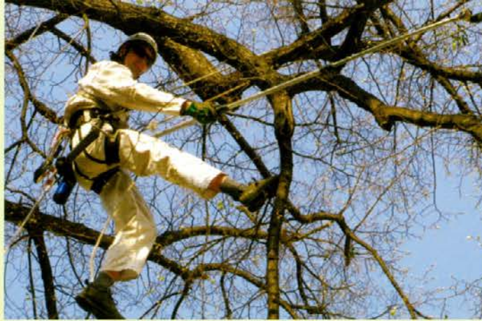
Drevesni plezalci so tisti, ki skrbijo tako za drevesa kot za okolico na najbolj prijazen način. Zaradi poznavanja vrvnih in plezalnih tehnik ter tehnik obrezovanja tudi najbolj kvalitetno.

filozofija dreves nekoliko drugačna. Imajo drugačno obliko in na splošno je njihovo življenjsko okolje precej drugačno, kakor pa v naseljenih področjih. Težijo predvsem navzgor, proti svetlobi, saj je gozd strnjen in drevesne krošnje prepuščajo manj svetlobe. Zato so drevesa povečini vitka in visoka. V gozdu gre za celoto, drevo je namreč le del večje združbe, večjega ekosistema, zato se gozdarstvo s posameznim drevesom večinoma ne ukvarja. Precej drugače živi drevo v urbanih okoljih, kjer se s skrbjo za drevesa ukvarjajo arboristi. Arboristika je veda, ki se ukvarja s proučevanjem, gojenjem in ohranjanjem dreves v urbanem okolju, ukvarja pa se z vsakim drevesom posebej. Beseda je izpeljanka iz latinske besede arbor – drevo. To je seveda povedano na precej poenostavljen način, saj arboristika v veliki meri temelji na poznavanju drevesne biologije, na drevo pa v urbanem okolju delujejo precej drugačni vplivi kakor v gozdu, veliko je tudi škodljivih. Življenjski prostor dreves v mestih je sila skrčen, vendar pa imajo precej več prostora za rast kakor tista v gozdu. In česar ne smemo zanemariti, drevesa so v naseljenih področjih precej odvisna od človekovega odnosa do njih, se pravi zavedanja, da so zaradi različnih dejavnikov pomembna za človekov življenjski prostor.