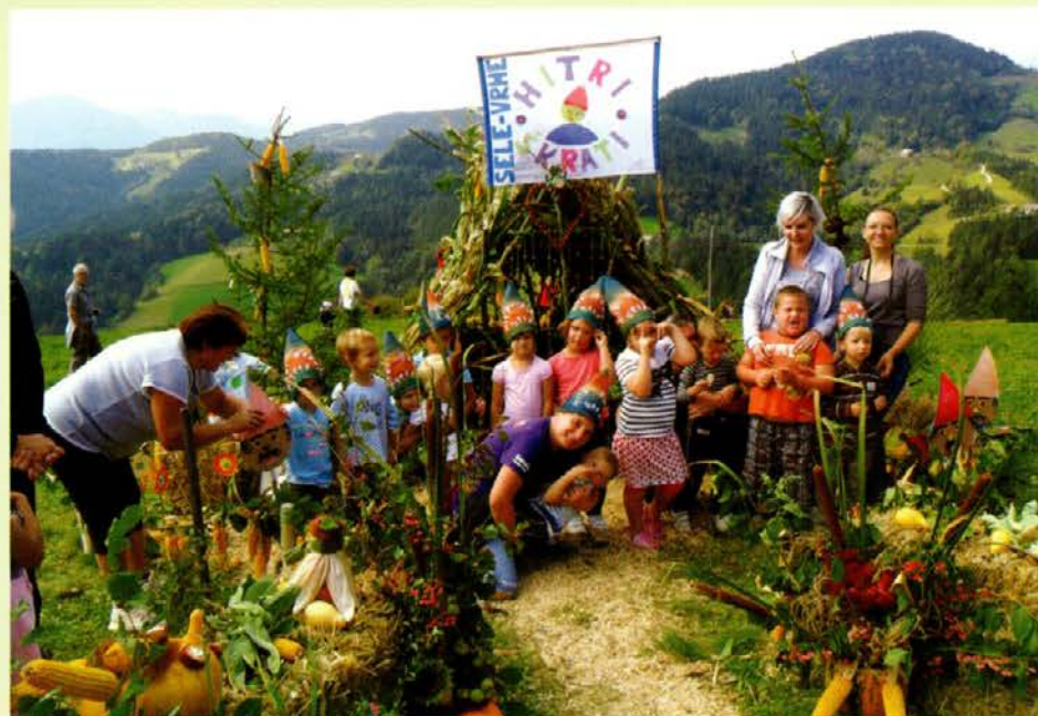
Hitri škrti pred svojo hiško