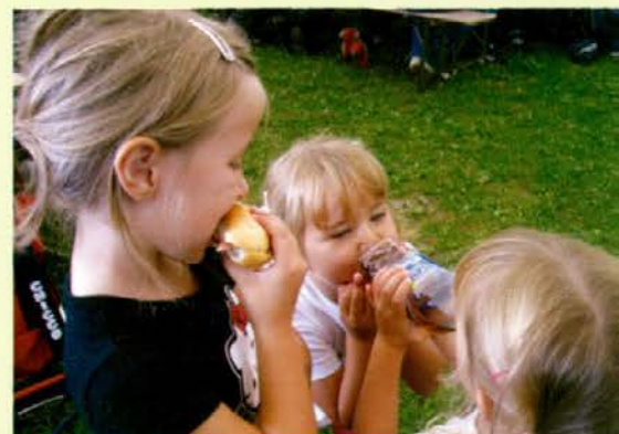
Utrinek s srečanja planincev – morda bo tudi ta mladež nekoč zapolnila vrste planincev