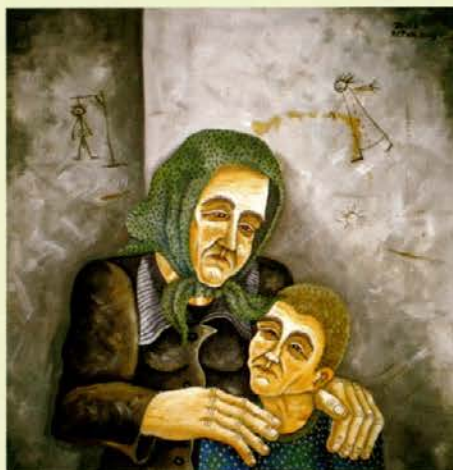
V varnih rokah

brezposelnih, zapuščenih, lačnih in pozabljenih, skratka ljudi, ki jih je tok civilizacije pozabil vpeti v življenje. Opozarja na stiske poštenega delovnega človeka, ki ga v današnjem svetu tako radi namerno ali nenamerno prezremo. Pove pa, da je na podeželju občutno manj stisk, ki ga naredijo tesnobnega, dokler se ne izkriči na slikah. V slike daruje tudi del svoje duše, kar je opazno, kakor hitro uzreš njegova dela. Njegova dela so v galerijah po vsem svetu in tudi v zasebnih zbirkah, na kar je zelo ponosen. Do danes je imel že okoli 80 razstav, in to samostojnih, doma in po svetu. Je reden gost slikarskih kolonij, kakršne zadnji dve leti prireja tudi sam in na njih gosti priznane umetnike. S tem se mu je izpolnila otroška želja o lastni koloniji. Če bi imel možnost, pravi, bi še enkrat izbral slikarsko pot.