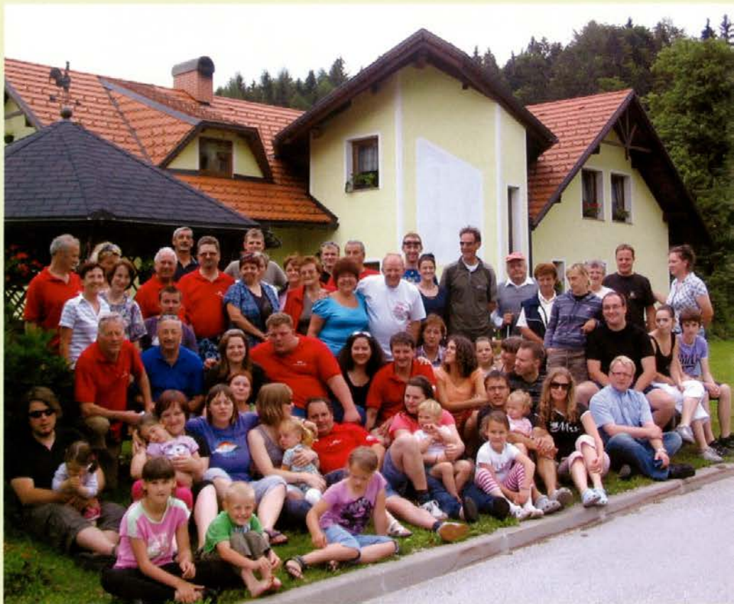
Svoje znanje, tako o odbojki kot o petju, MPZ Ksaver Meško rad deli z Darom, zato vsi upajo, da bo pevskih in športnih srečanj v prihodnosti še več.