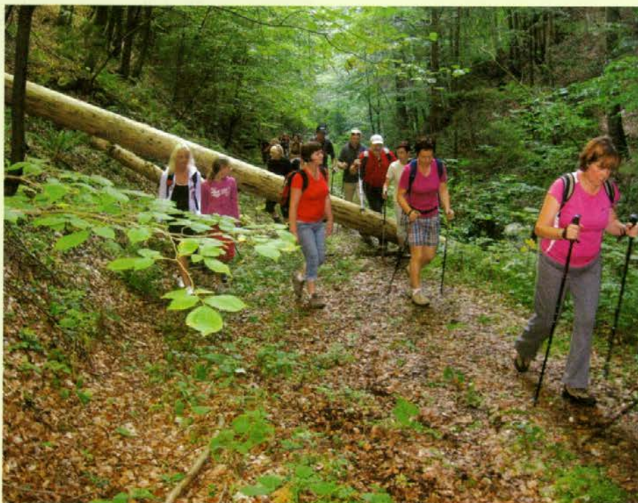
Pohodniki na tradicionalnem pohodu po GTP Plešivec v soteski Kaštel

Natrosil sem vam nekaj zanimivih in prijetnih septembrskih informativnih storžev, ki so nam gozdarjem popestrili naš birokratsko obarvani delovni čas pa tudi proste dni!