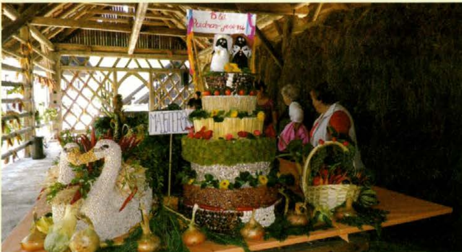
Jesen malo drugače

Lepo jesensko vreme je zares ustreglo organizatorjem te prireditve, žal pa tudi letos med udeleženci nismo zasledili veliko domačinov, več je bilo obiskovalcev iz drugih bližnjih krajev in zaselkov. Morda bo potrebno v prihodnje tej prireditvi dodati še kakšno dodatno vsebino, ki bo bolj vabljiva tudi za domačine.