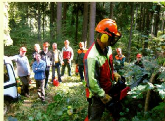
Za gozdnogojitvena dela je motorna žaga SOLO še posebej primerna zaradi avtomatskega brušenja verige

srednje debelo jelko. Natančno smo določili smer podiranja, napravili pravilen zasek, enakomerno podžagali, zavarovali delovišče, določili debelino in obliko ščetine, jelko podrli ... in bili razočarani. Padla je točno v predvideno smer, ampak del ščetine je imel posebej močna vlakna, tako da je pri padanju nekoliko razklal deblo. Kot generali po bitki smo modro ugotovili, da bi bil v tem primeru primernejši globlji zasek. Po stari holcarski navadi je sledilo še okusno in obilno kosilo, za kar se še posebej zahvaljujem gospodinji in njenim pomočnicam. Razšli smo se z mislijo, kako nujno potrebno se je nenehno izobraževati in da nam ne sme nikoli biti žal za tiste urice, ki si jih utrgamo za to. Vsem fantom, ki bodo opravljali izpit iz NPK, želim veliko uspeha, predvsem pa, da bodo vse pridobljeno znanje kot del opreme jemali s seboj v gozd in ga tam s pridom uporabljali.