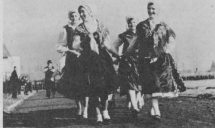
Kopanjarice iz Markovc

Priprave za 13. kurentovanje in karneval v Ptuj so v polnem teku. Organizatorji, folklorno in turistično društvo v Ptuj, so nam na