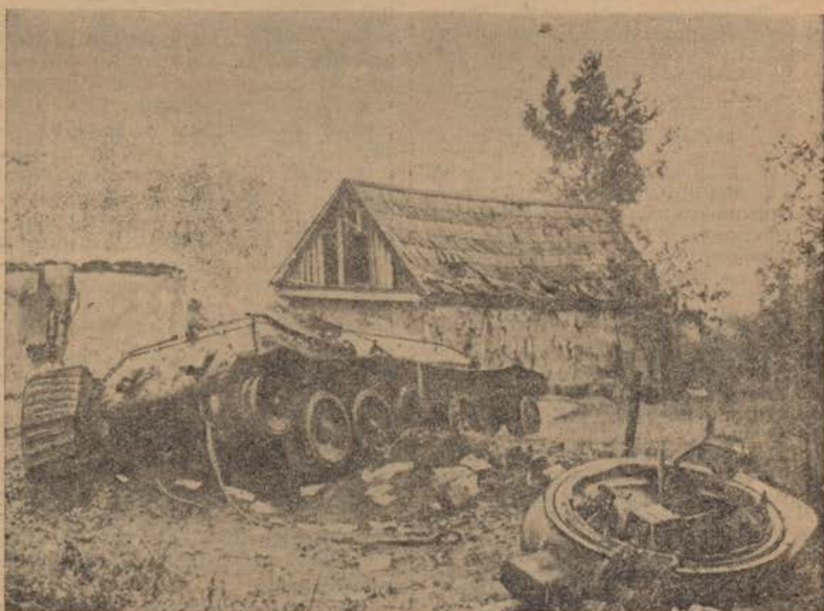
(PK. Altstadt-Aufnahme) Zerschossener sowjetischer Panzer im Kampigelände des Dnjepr.

Počastitev Führer-ja in petje himne je tvorilo zaključek zborovanja.