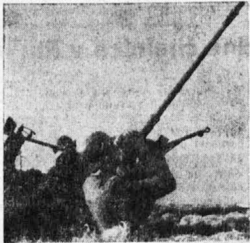
Nemška protiletalska obramba ob Kanalu