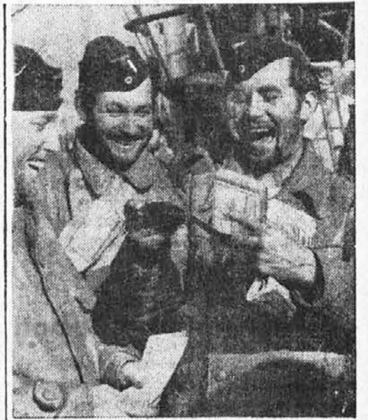
Pošta je prišla...

Veliki umetnik Stoewing pravi v svojem delu o Stradivarijevih goslih: »Toa Stradivarijeve violine je brezmejen, nima dna ne kraja. Z najmanjšim dotikom strun se človeku zdi, da se dviga ton iz tajinstvenih globin, kakor boginja Afroditá iz mirne gladine morja. Kakor prelestna koprena lepoticé se širi glasba in trepeče na valovih zraka. Če dodamo tej lepoti še nedosegljivo svežost, mehko in zmagovito, daljnosežno moč sočnosti in sijaja, tedaj imamo res največ, kar more dati ton gosli, kakršnega ni dosegel nihče pred in po Stradivariju.«