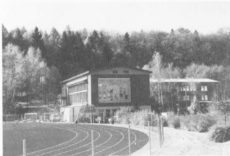
DTK bo po koncu notranjih prenovitvenih del (zaključena naj bi bila še v novembru) obiskovalcem nudil še boljše pogoje za šport in rekreacijo.

Uspešno igrajo tudi nogometaši MNK Fužinarja v prvi skupini Mariborske nogometne zveze. Po 11. igralnem dnevu so bili Ravenčani prvi na lestvici s