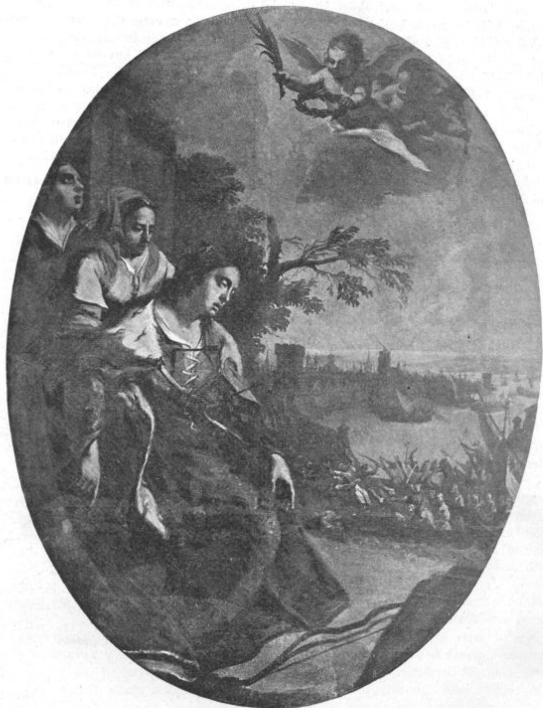
Smrt sv. Uršule.