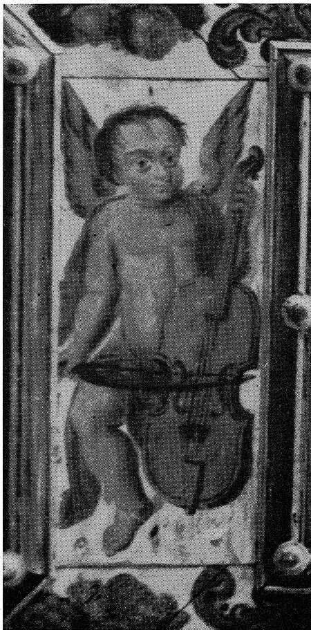
Gosteče — detajl: angel z violončelom