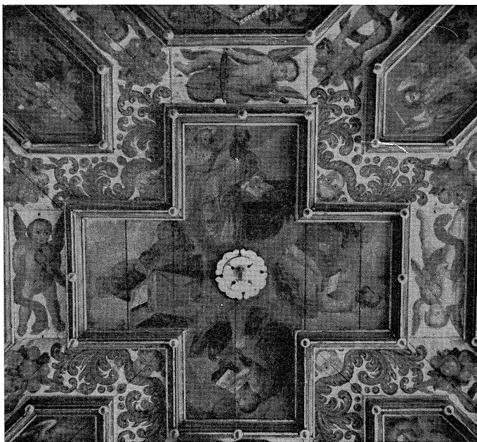
Gosteče — osrednji križ na poslikanem stropu z angeli z glasbili (violina, violončelo, violina)

angeli z glasbili, angelske glavice, girlande in šopi sadja, na ogliščih so cofki. Vseh angelov z glasbili je preko trideset. Večina izmed njih ima trobente in so tipično dekorativni element. Od štirih angelov, razporejenih okrog srednjega križa, imata dva violino, po eden pa violončelo in lutnjo. Tudi tu je drža podobna kot v Srednji vasi, instrumenti so upodobljeni precej shematično in tudi sestav ansambla je podoben kot v Srednji vasi, le da tu manjkajo dude. Očitno je bilo nagnjenje slikarja do godalnih instrumentov, saj je naslikal violino dvakrat in violončelo enkrat. Okrog trideset angelov s trobentami je razporejenih po vsem stropu.