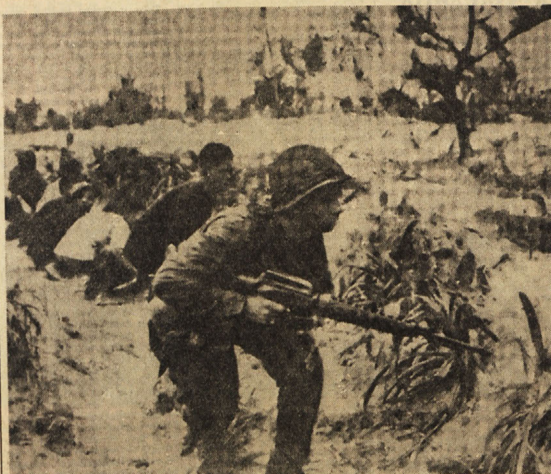
Ameriški vojak v Vietnamu, ki nadzoruje kmete na polju, odgovarja na streljanje skritega partizana

NEW YORK, 27. — Odbor za skrbitvo OZN je odobril z 90 glasovi proti dvema (Portugalska in Južna Afrika) in 18 vzdržanimi (med katerimi Francija in Velika Britanija) afriško-azijsko resolucijo, ki poziva britansko vlado, naj uporabi silo, da zruši Smithov režim v Rodeziji, ter poziva varnostni svet, naj odredi nove obvezne gospodarske sankcije proti Rodeziji.