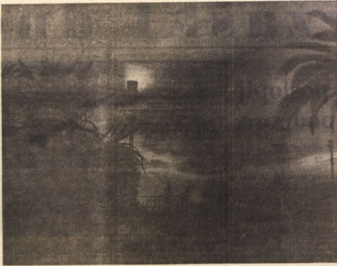
Jesenski večer na Sinji obali

Ob koncu še kratka ugotovitev: Nekatere v začetku smo omenili, da imo mestoce Novi Bor stara tradicijo v steklarski industriji. Zanimivo je, da se je pri gradnji novega steklarskega podjetja izkazalo jugoslovansko podjetje, ne pa kako domače. S tem bi hoteli poudariti, kako naglo se je razvila jugoslovanska tehnika, da se je mogla uveljaviti tudi v deželi s tako staro industrijsko tradicijo.